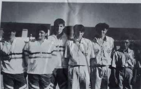
Champions et vice-champions juniors.

pouvait commencer. Difficile ici de suivre toutes les parties, mais au fil des jeux j'ai pu voir la détresse des uns et l'assurance des autres, des déconvenues cinglantes et de vrais exploits, des minois consternés et des explosions de joie. Dans ces catégories d'âges, chaque partie est un véritable petit drame qui se joue. L'œil du coach et la présence des parents venant encore augmenter la sensibilité des participants. Témoin cette partie