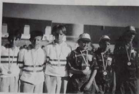
Champions et vice-champions cadets.