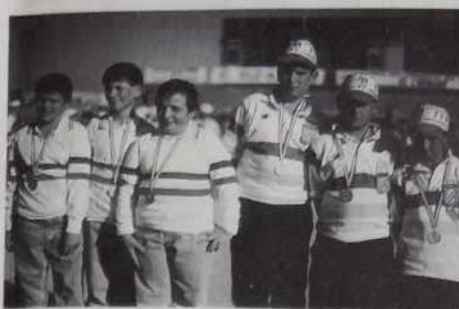
Champions et vice-champions minimes.