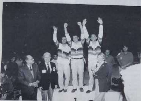
Les Franciliens, champions du monde.

Championnats de France juniors, cadets et minimes.