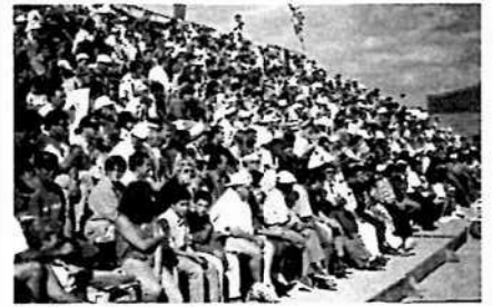
Les jeunes font recette.