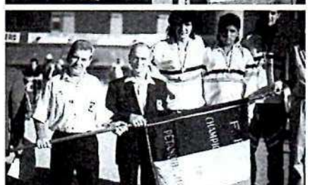
Ci-dessus et de haut en bas.