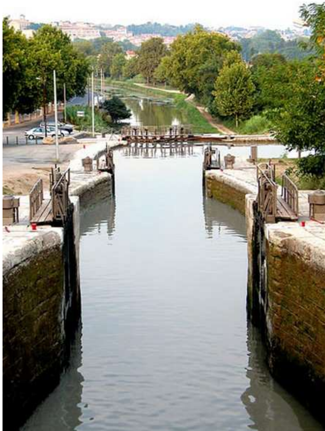
Les 7 écluses de Fonserrannes, un des ouvrages majeurs du Canal du Midi, au pied de la ville de Béziers

Ce Championnat de France Triplette cadet , s'est déroulé les 3 et 4 septembre 1994 à Béziers (34).