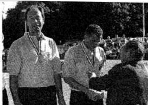
L'équipe des Bouches-du-Rhône, déçue à perdu face à celle de Melun.