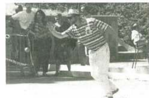
Un Belfortain à l'œuvre, devant une poignée de supporters.

A la faveur d'une cagna frisant les 30°C, les premières épreuves du championnat de France doublettes de jeu provençal ont démarré hier. Ambiance... méridionale.