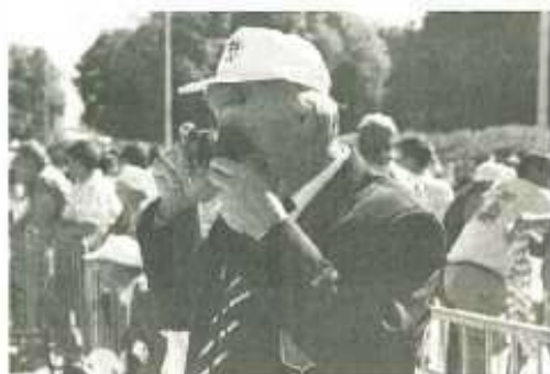
Photo souvenir au pied du Fort Hatry.