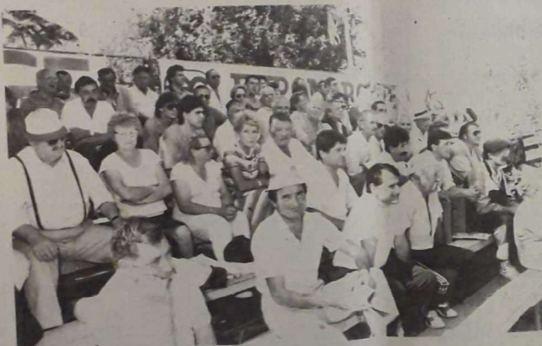
Le public : de vrais supporters du jeu provençal.

Le championnat du monde de pétanque en féminin doublettes aura lieu à Bangkok (Thaïlande), du 21 au 24 novembre. Le championnat du monde de triplettes hommes se déroulera du 4 au 7 octobre, à Monaco.