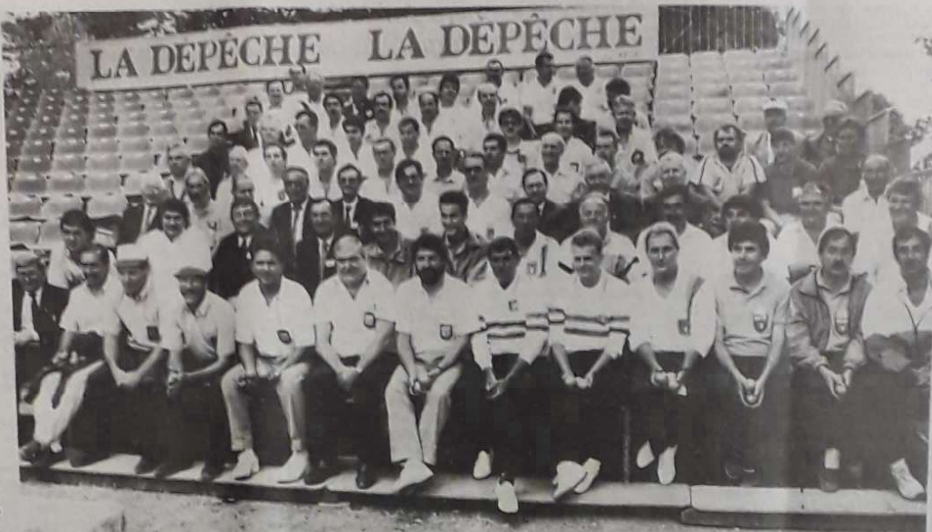
La pyramide du cours Foucault ou les champions du jeu provençal réunis, entre deux parties, sur les tribunes du terrain central. Ne cherchez pas une région manquante : le jeu provençal, comme son nom ne l'indique pas, est un sport décentralisé et toutes sont représentées.

Différent de la pétanque, le jeu provençal nécessite adresse et élan, plus que simple maîtrise de la cible.