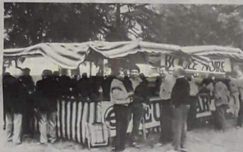
Le championnat de jeu provençal, c'est aussi un moment de détente et de fête où tout le monde se retrouve, après la compétition, devant la buvette.