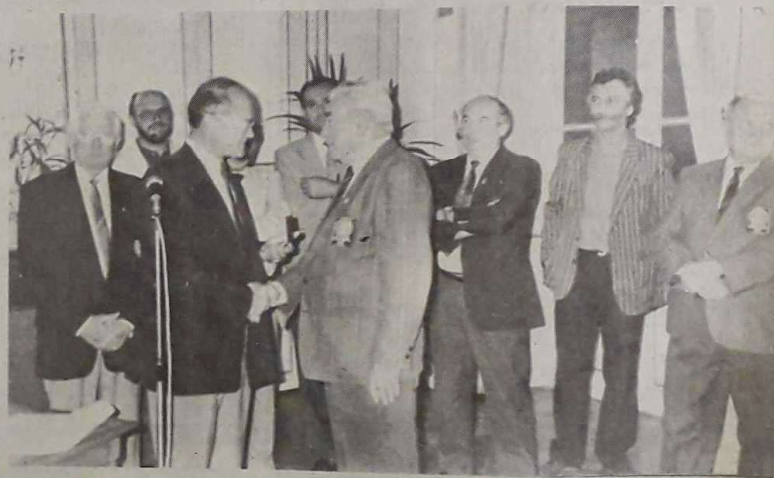
C'est toute une fédération qui a reçu, avant-hier, la médaille de la ville.