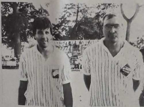
Equipes demi-finalistes : SIGAL et BERTRAND.

Un éventail de quatre équipes de « ténors » du jeu provençal s'opposera aujourd'hui, au cours Foucault, en demi-finales et finale de cette quatorzième édition du championnat de France. Place aux virtuoses.