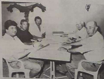
Le comité départemental réuni pour le tirage du tableau.

Le service médical sera assuré par le Croix-Rouge française.