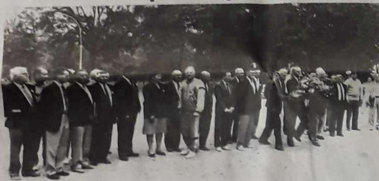
La compétition était interrompue, hier, quelques minutes, durant le dépôt de gerbe devant le monument aux morts du cours Foucault. Autour du maire de Montauban et du président de la fédération, c'est toute une foule d'amis qui participaient à cette commémoration.