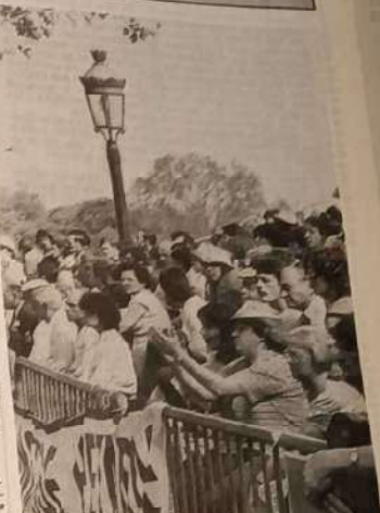
10 h du matin : la foule est déjà dense... et s'agrippe à l'arène où vont se dérouler les phases finales de cette septième édition du championnat de France. « Que le spectacle commence » semblent dire ceux visages tendus vers le même objectif.