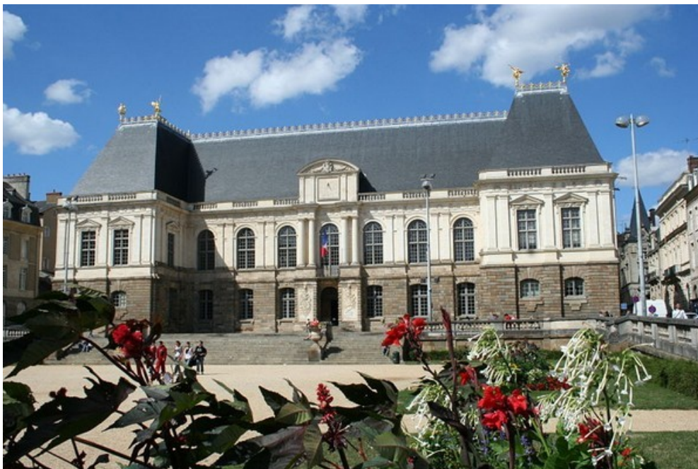
Le magnifique Palais du Parlement de Bretagne à Rennes, qui a été reconstruit suite à l'incendie de 1994

Ce Championnat de France corporatif , s'est déroulé à Rennes (35) les 18 et 19 juin 1988.