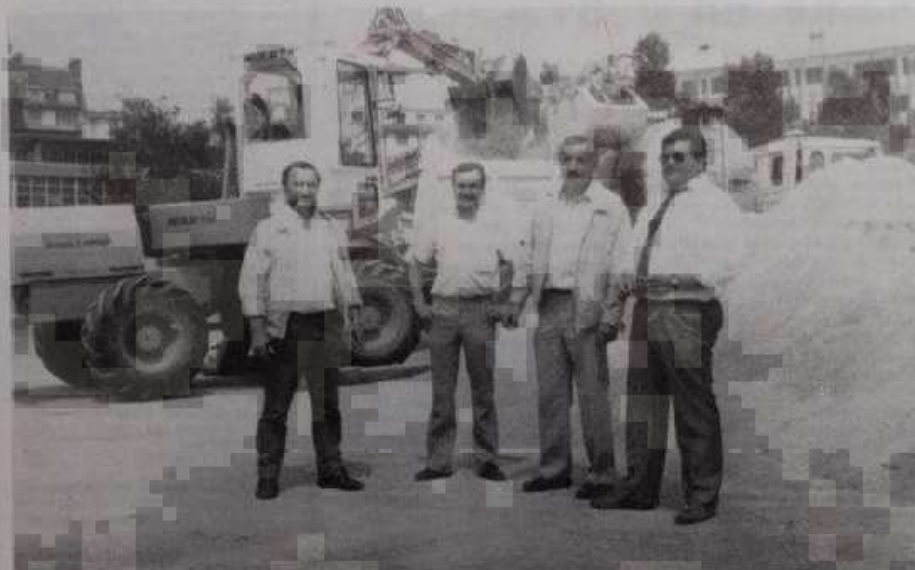
Les membres du Comité départemental de pétanque sont venus voir les travaux d'aménagement du Champ de Mars.