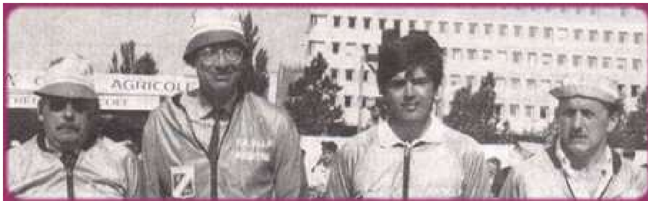
Le corps arbitral de ce Championnat corporatif à Rennes en 1988