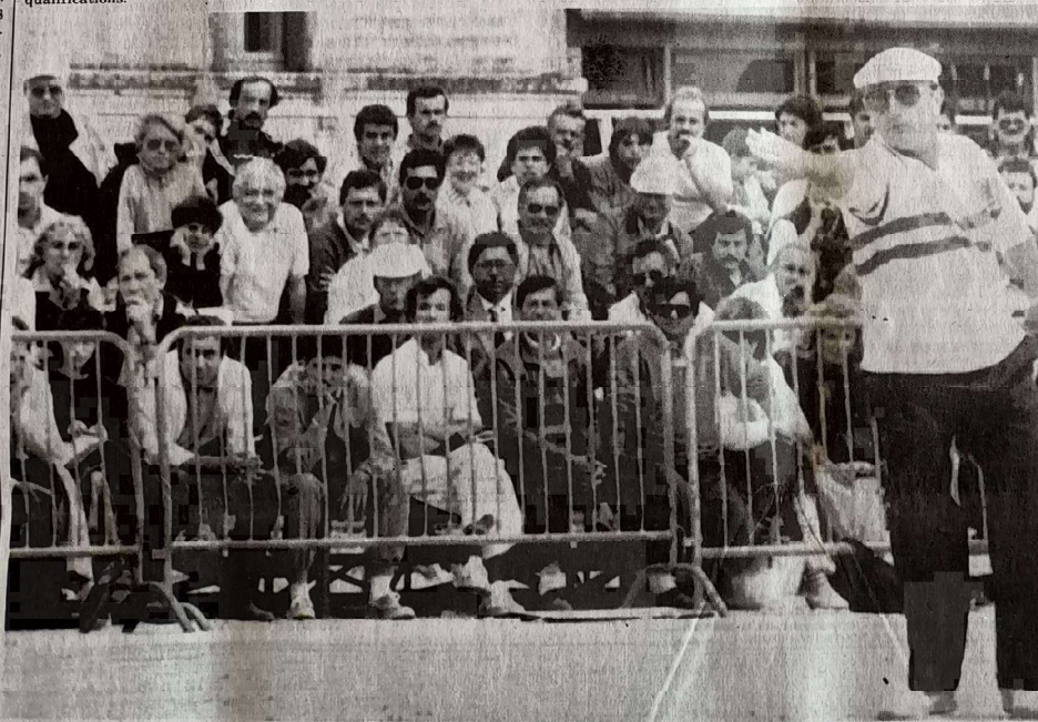
A. Gers, le capitaine de l'équipe de Charente-Maritime qui s'est octroyé à nouveau le titre

Arbitres du club: MM. B. Dubreuil, S. Chambaud.