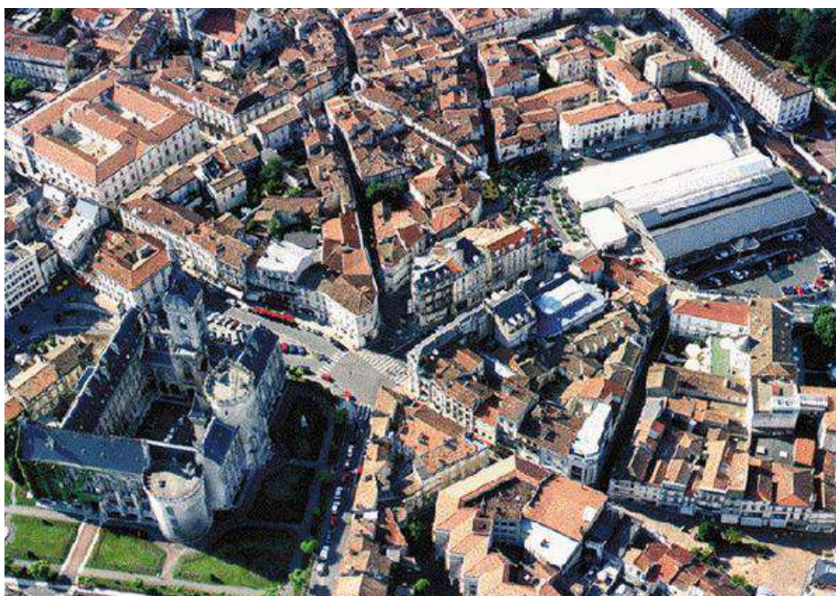
Vue aérienne de la ville d'Angoulême, en Saintonge, à gauche le château des Comtes d'Angoulême, devenu l'Hôtel de Ville

Ce Championnat de France corporatif , s'est déroulé à Angoulême (16) les 20 et 21 juin 1987.