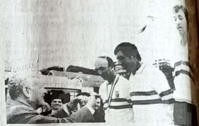
Le président de la Fédération remet les médailles aux champions, l'équipe Gers

Le titre est revenu à l'équipe de Rochefort