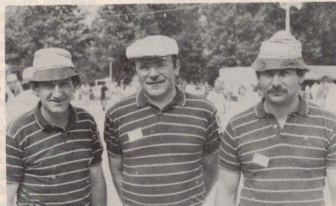
Quelques unes des équipes au stade des 1/4 de finale.