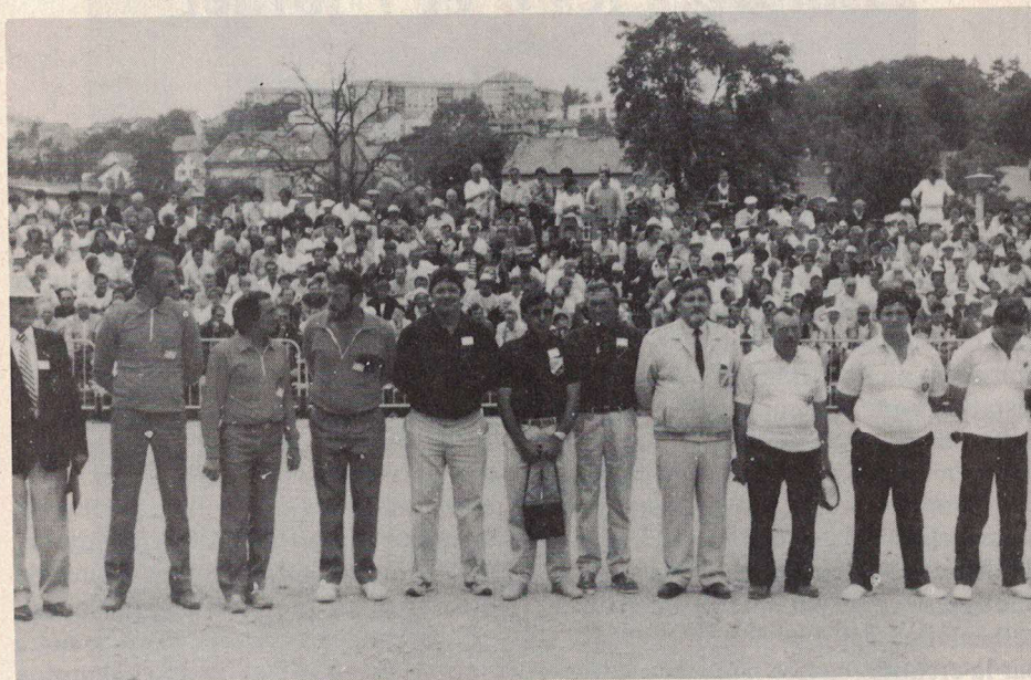
En finale : les vainqueurs, les arbitres et les finalistes.

Les P.T.T. à l'honneur en finale la famille Olmos s'incline devant une brillante équipe varoise.