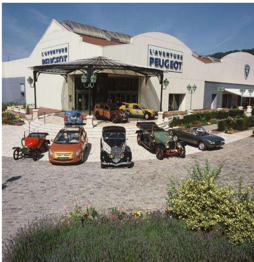
Le musée de l'Aventure de l'Automobile Peugeot, fondé en 1988 à Sochaux-Montbéliard

Ce Championnat de France corporatif , s'est déroulé à Montbéliard (25) les 15 et 16 juin 1985.