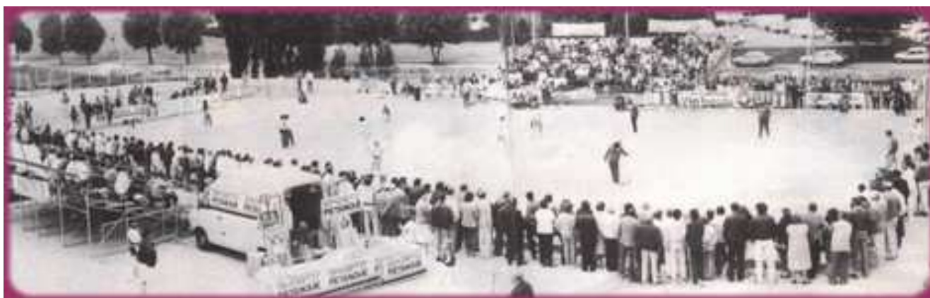
Une vue générale des terrains d'honneur de ce Championnat féminin à Créteil en 1986