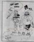
Réf. T 01