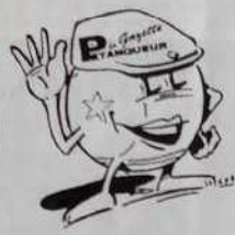
Dessin figurant sur les 3 articles ci-contre

Tailles : S / M - L - XL : 80 Francs ou 8 bons parrainage de 2 à 14 ans : 60 Francs ou 6 bons parrainage