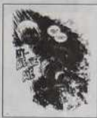
Réf. T 07