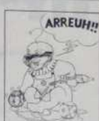
Réf. T 05