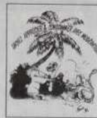
Réf. T 06