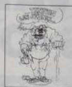
Réf. T 02