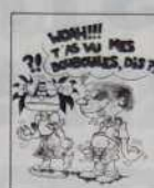
Réf. T 03