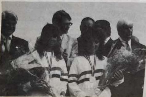
Championnes de France.