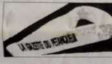
BANDEAU FLUO Réf. B 01 imprimé

"La Gazette du Pétanqueur" existe en jaune, vert, rose 20 Fr. ou 2 bons parrainage