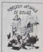
Réf. T 08