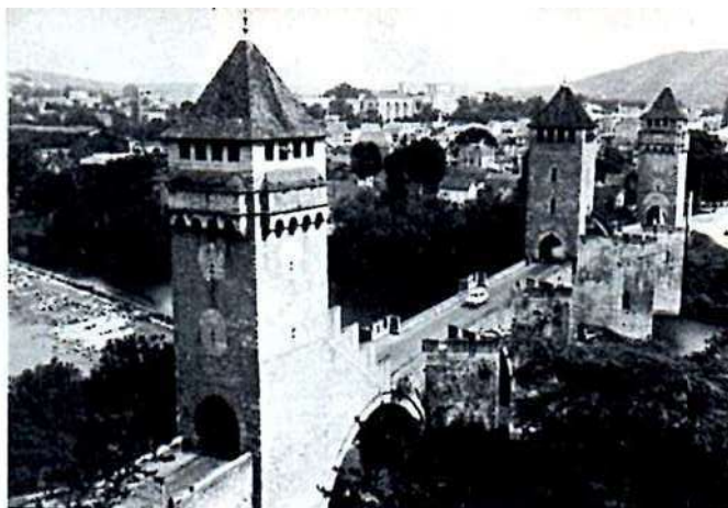
Le magnifique et célèbre Pont Valentré sur le Lot.

Très belle finale donc opposant 2 équipes d'égale valeur.