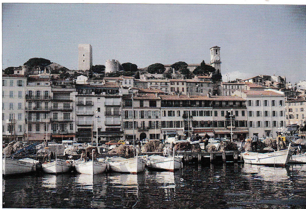
LE SUQUET - LE VIEUX PORT