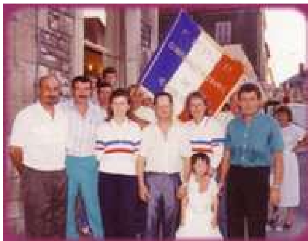
A leur retour en Bourgogne, les Championnes de France féminin 1991, ont été célébrées, par leur club du Drapeau à Dijon

(1-0, 4-1, 5-1, 5-1, 5-1, 5-2, 6-2, 11-2, 11-5, 13-5)