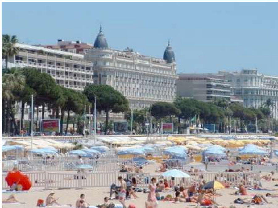
La célèbre cité balnéaire de Cannes : son festival, sa croisette, ses plages et son hôtel Carlton

C'est la ville de Cannes (06), qui a été l'hôte de ce Championnat de France féminin pétanque, en remplacement au dernier moment, suite au forfait de la ville de Vallauris .