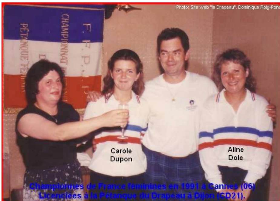
Championnes de France féminines en 1991 à Cannes (06) Licenciées à la Pétanque du Drapeau à Dijon (CD21).