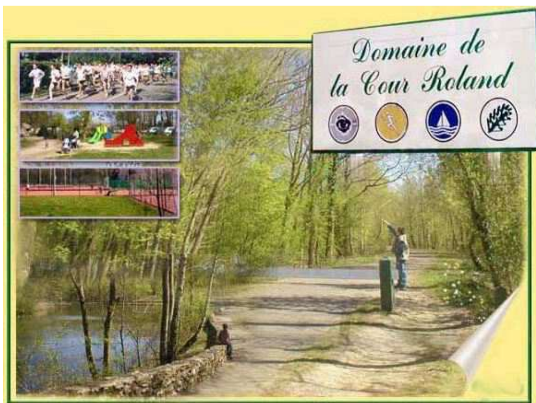
Le Domaine de la Cour Roland, où s'est déroulé ce Championnat de France, en 1992 à Jouy-en-Josas

C'est la ville de Jouy-en-Josas (78), qui a été l'hôte de ce Championnat de France féminin pétanque.