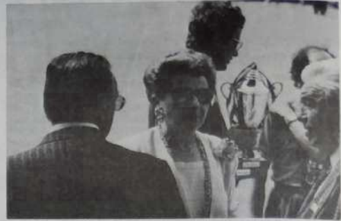
Madame le maire de Jouy-en-Josas.