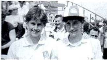
Le comité d'organisation.