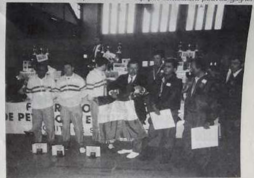
Les finalistes à la remise des prix

Dans les demi-finales, les quatre équipes semblaient pouvoir gagner