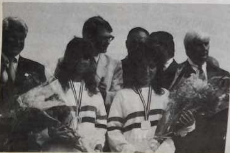
Championnes de France.