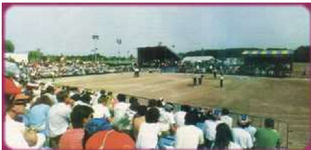
Une vue générale de la phase finale de ce Championnat de France, le dimanche après-midi

Les tenantes du titre 1991 du (21) : Dole, Dupon se sont inclinées en 1/4 de finale, face aux futures Finalistes de Naert, Moreau (92) sur le score de 11 à 13.