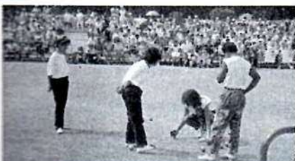
Ci-dessous : Le carré d'honneur durant la finale.