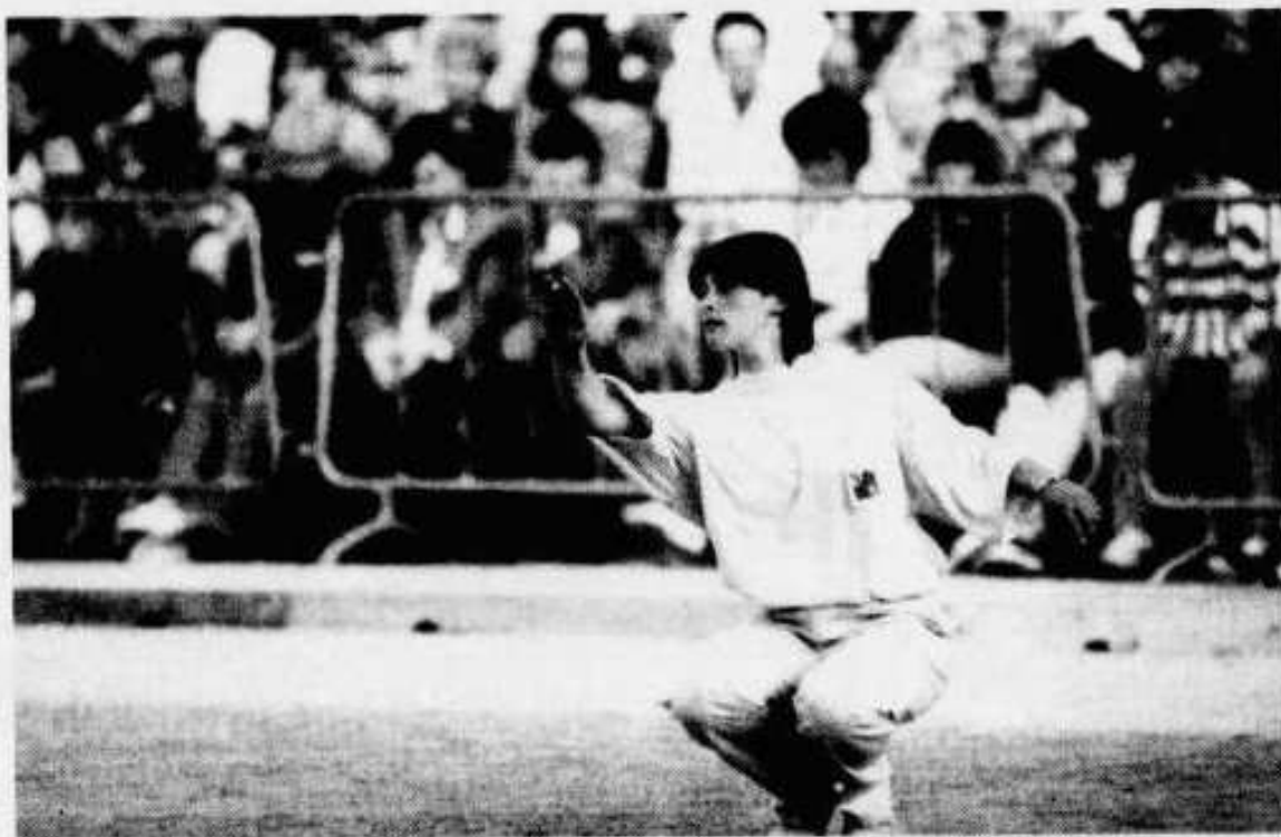
Les meilleures joueuses de pétanque de France ont réussi une démonstration de haut niveau et très suivie au parc des expositions de Caen.

« C'est un succès qui prouve que la Normandie est un pays de pétanque. Ce succès aura-t-il des suites ? La majorité du comité serait prête à organiser un nouveau championnat, malgré l'ampleur