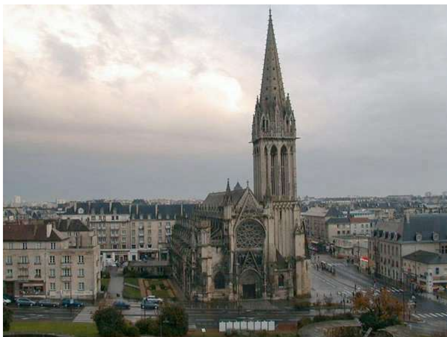
Une vue générale de la ville de Caen, qui a reçu ce Championnat de pétanque Doublette féminin en 1995

C'est la ville de Caen (14), qui a été l'hôte de ce Championnat de France féminin pétanque.