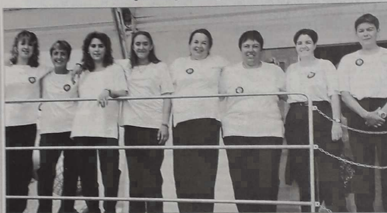
Les Landaises n'entraient pas dans le dernier carré.

Déception chez les Landaises où aucune des quatre doublettes féminines ne se qualifiait pour les phases finales