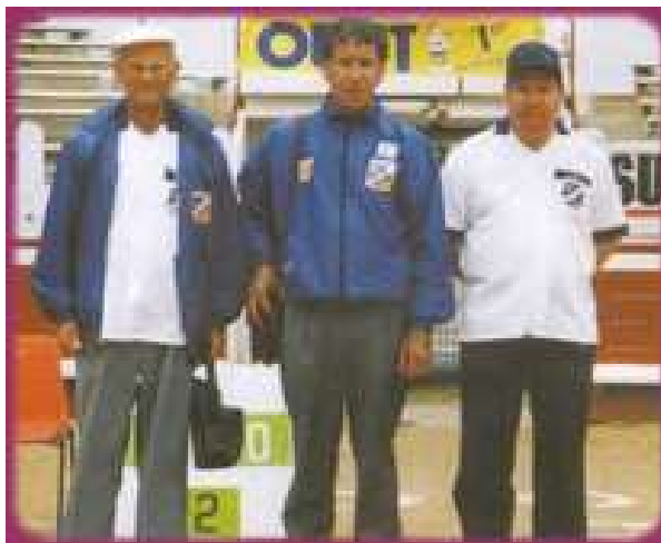
Les arbitres qui ont officié lors de ce Championnat de France féminin, à Soustons en 2001