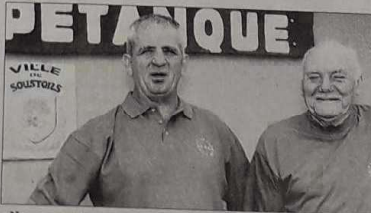
« Nous apportons notre quote-part à ce championnat de France de féminines en doublettes »

La participation du club à l'événement commençait dès le début de l'année avec la recherche d'annonceurs indispensables à l'édition de la plaquette. Aucun des neuf membres du bureau du club ne se trouvait exempté du démarchage. « Les résultats ont dépassé nos espérances. Nous avons reçu un ac-