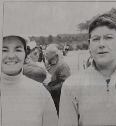
L'équipe de Hossegor

Cette doublette ne fera sûrement pas la même erreur que l'année dernière. Elle a déjà déçu après avoir disposé des championnes sortantes. Expérience acquise, le titre n'est pas utopique pour ces Landaises.