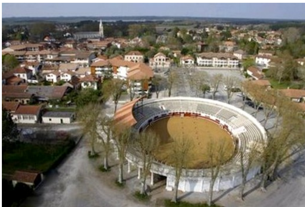
Les arènes de Soustons, où se sont déroulées les phases finales, de ce Championnat de France féminin en 2001

La ville de Soustons (40), a été l'hôte de ce Championnat de France Doublette féminin.