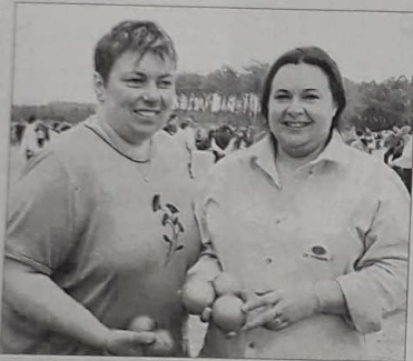
L'équipe de Tyrosse

Très complètes dans la vie, elles ne devraient pas subir la pression de la compétition malgré leur première participation à une compétition de prestige. Parvenir à entrer dans les arènes le dimanche serait pour elles une bonne performance.