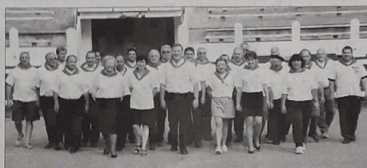
Organisation d'expérience pour le comité directeur landais qui organise un quatrième championnat de France

fémmes. Celles-ci adoptent de plus en plus la portée de boule en raison d'une musculature différente. Une meilleure maîtrise d'elles-mêmes les conduit à privilégier l'accès au point préféré au tir. Très attentives à leur hygiène de vie, elles franchiront une nouvelle étape sportive par le suivi plus régulier des entraînements et en bénéficiant d'un coaching plus soutenu.