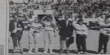
Les finalistes saluant après la compétition