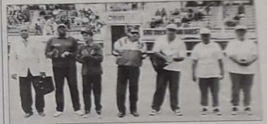
La finale de la coupe des Dom-Tom trouva son épilogue au terme de 11 ménés

En finale, dimanche dans les arènes de Soustons, la Polynésie française représentée par Tahiti a été défaite par l'équipe de la Martinique