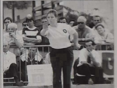
Les féminines représentent 14 % des effectifs licenciés en France, et 18 % dans les Landes