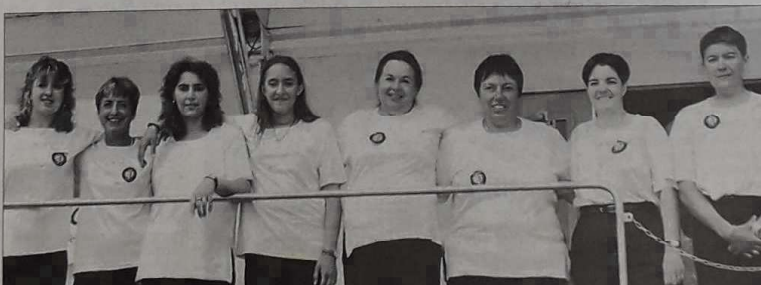
Les finalistes saluant après la compétition

Déception chez les Landaises où aucune des quatre doublettes féminines ne se qualifiait pour les phases finales