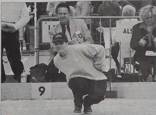
« La réflexion évite les mauvais réflexes »

Estomac. — Il est primordial de prendre un bon petit-déjeuner et de prévoir une collation, se conten-