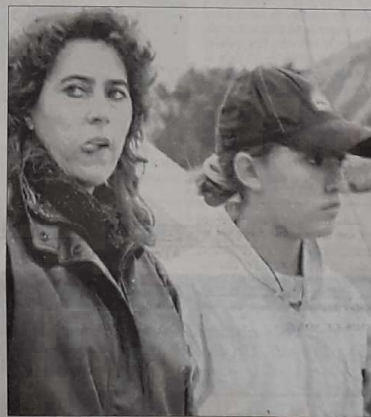
L'équipe de Saint-Sever