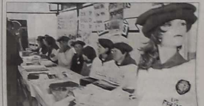
Hôtesse avec bérêts du Sud-Ouest

Coiffées de bérêts rouges, de souriantes hôtesse proposaient de nombreux articles promotionnels sur le thème de la pétanque et du sud-ouest de la France. Un accueil de charme auquel succombèrent bien des participants et spectateurs.