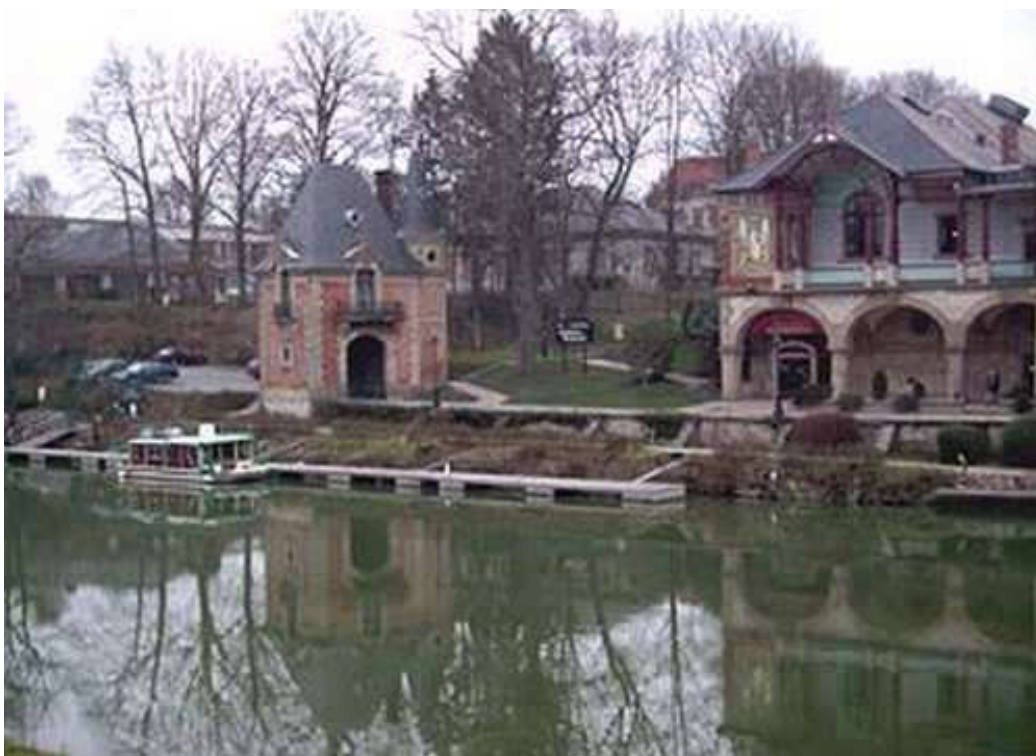
Le lycée Henri Nominé à Sarreguemines. Ce magnifique bâtiment était le lieu de restauration durant ce Championnat

Le 1 er Championnat de France Doublette mixte , les 10 et 11 juillet 1993 à Sarreguemines (57), aura été en fait le 1 er Trophée National mixte (jusqu'à sa 2 ème édition en 1994).