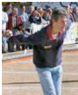
Un Champion du (06)