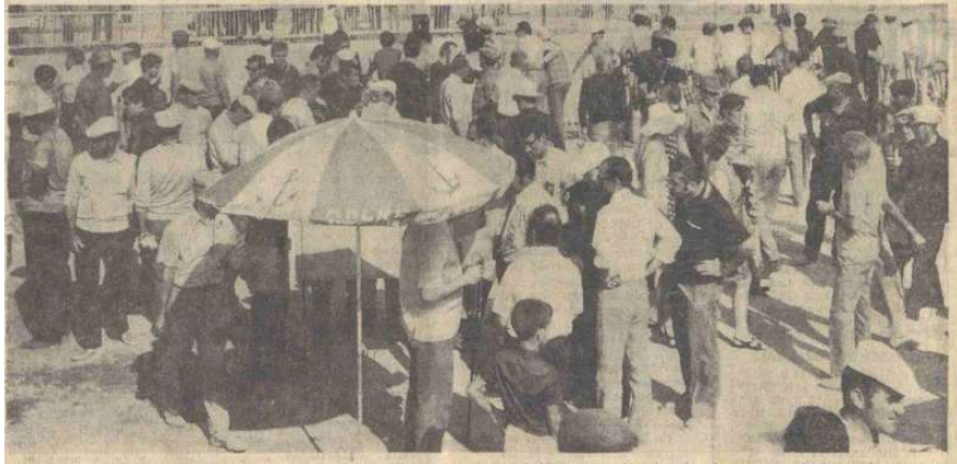
Au cours des éliminatoires, l'animation était hier intense au Centre Omnisports de Vichy où se déroulent les championnats de France de pétanque