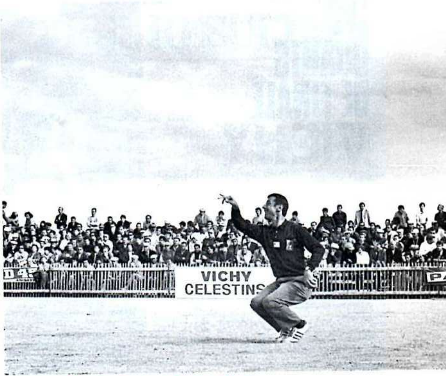
Très belle attitude de PAON en Finale.

Tout au long de la foule massée derrière les barrières, dans les tribunes, les Auvergnats