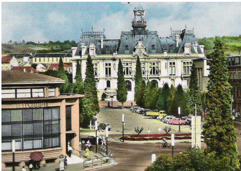
La mairie de la ville de Vichy dans les années 70, qui a accueilli ce Championnat senior

Ce Championnat de France Triplette senior pétanque , s'est déroulé les 27 et 28 juin 1970 à Vichy (03).