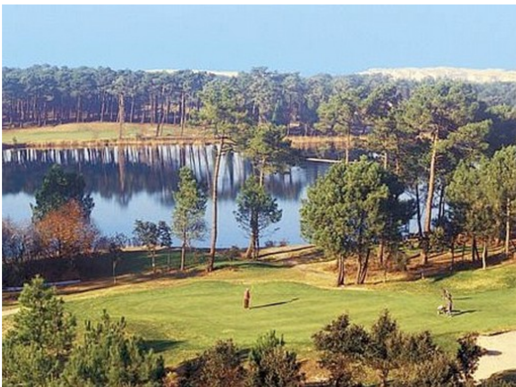
Les environs Landais, de la ville de Soustons et son golf de Pinsolle

Ce Championnat de France Triplette senior pétanque , s'est déroulé les 29 et 30 juin 2002 à Soustons (40).