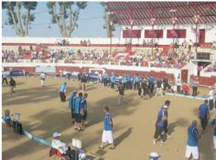
Les arènes de Soustons, le dimanche matin, cadre de nombreux Championnats de France pétanque