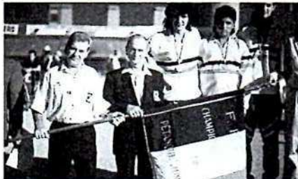
Ci-dessus et de haut en bas.