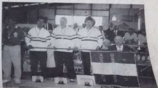
Champions de France corpo.