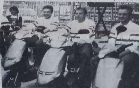
Les champions de France triplettes chevauchant leur cadeau de champion.

Bien entendu, comme chaque année, nos meilleurs représentants étaient présents et la lutte pour le titre suprême s'avérait des plus âpres. Au sortir des poules, après