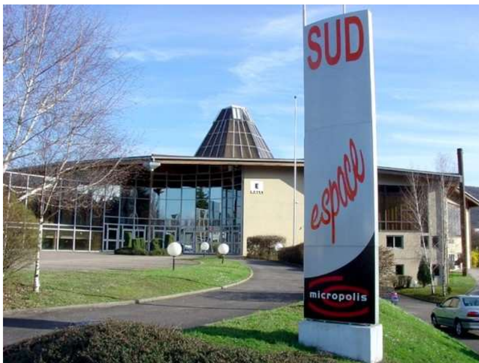
Le palais des Congrès de Micropolis à Besançon, où s'est déroulé ce Championnat de France corporatif en 1994

Ce Championnat de France corporatif , s'est déroulé à Besançon (25) les 18 et 19 juin 1994.