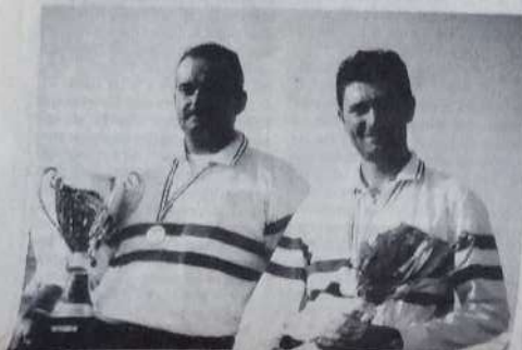
Champions de France doublette.