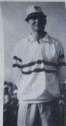
Champion de France tête à tête.