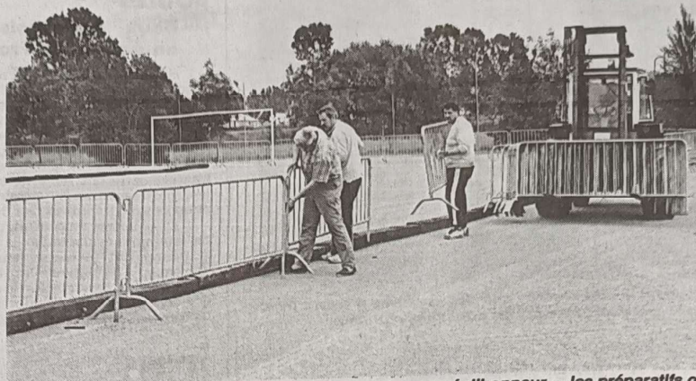
Tant à La Ponétie qu'à Baradel, où sera en place le « carré d'honneur », les préparatifs ont été bon train afin qu'Aurillac accueille au mieux ces championnats de France de pétanque.