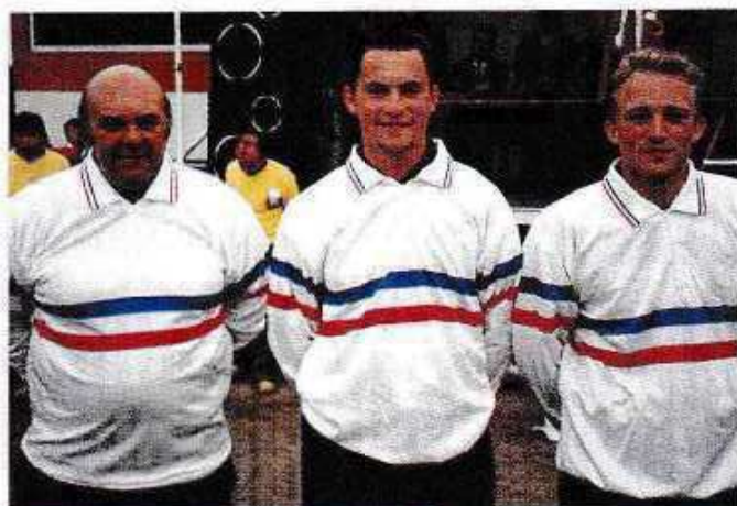
Les champions de Seine-Maritime