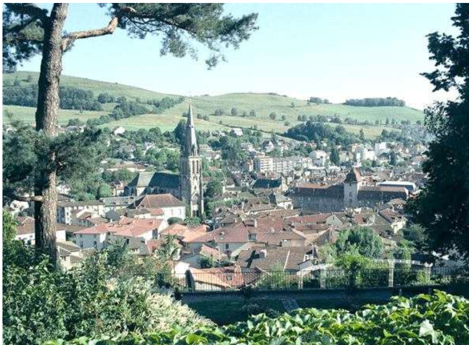
La ville d'Aurillac, qui a accueilli ce Championnat de France corporatif en 1995

Ce Championnat de France corporatif , s'est déroulé à Aurillac (15) les 17 et 18 juin 1995.