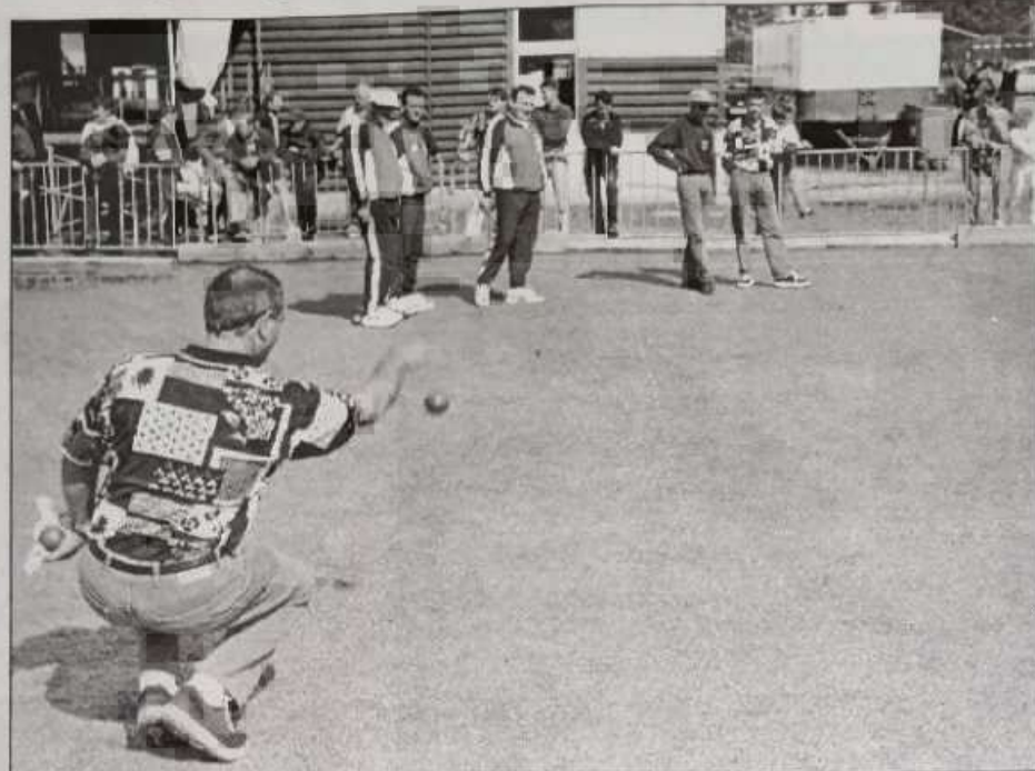
Il pointe ou il tire.