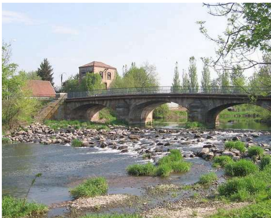
La Rivière L'Oignon, qui fait souvent ses petits caprices, en inondant les quartiers de Lure

Ce 20 ème Championnat de France corporatif , s'est déroulé à Lure (70).