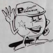
Dessin figurant sur les 3 articles ci-contre

Tailles : S / M - L - XL : 80 Francs ou 8 bons parrainage de 2 à 14 ans : 60 Francs ou 6 bons parrainage