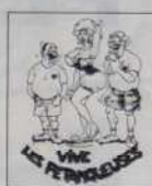
Ref. T 04