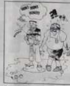
Ref. T 01