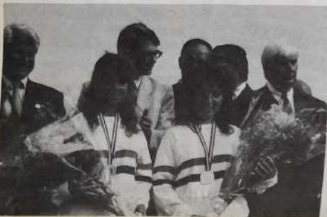
Championnes de France.