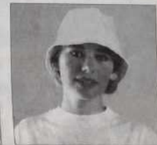
Bob - Réf. C 03 blanc/bleu - blanc - bleu marine blanc/orange - noir - rouge 25 francs ou 2 bons parrainage