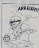
Ref. T 05