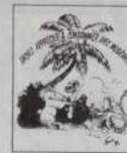
Ref. T 06