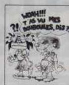
Ref. T 03