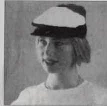
Casquette bouliste - Réf. C 01 multicolore ou blanche 30 francs ou 3 bons parrainage