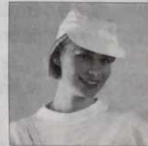
Casquette base-ball - Réf. C 02 blanche, blanc/jaune blanc/bleu, blanc/rouge, orange 15 francs ou 1 bon parrainage