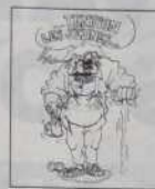
Ref. T 02