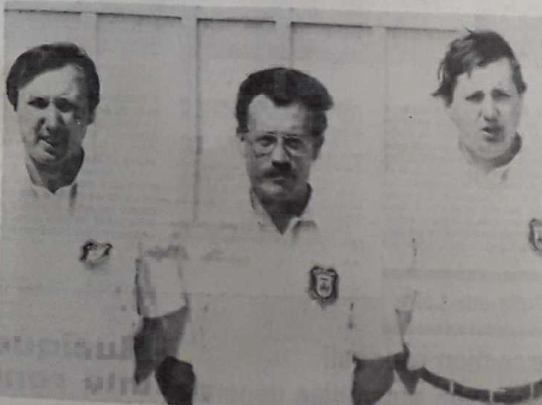
Inesta-Sevestre-Nardoux, la meilleure équipe du Loiret

Orléans. — « Ce n'est pas mal, mais cela aurait pu être mieux », ce constat s'appliquait bien aux équipes du Loiret.