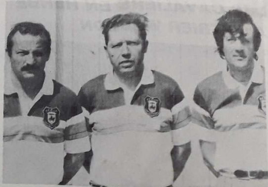
Soler-Barthélémy-Nizan n'ont pas eu beaucoup de chance