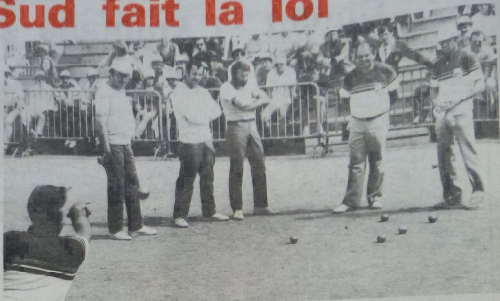
Les deux équipes finalistes face à face.

tour, mais se faisait éliminer au tour suivant lors des cadrages par l'équipe de l'Ariège sur le score sans appel de 13-3. Malgré tout l'équipe P.T.T. du Loiret se voyait attribuer la coupe du département non pas pour sa performance mais parce qu'elle s'est distinguée vis-à-vis de ses deux rivales.