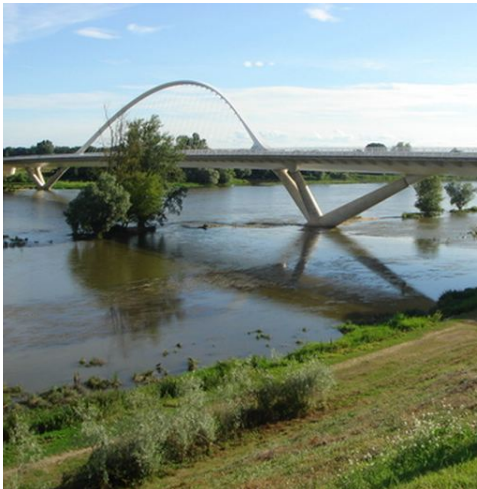
Le pont de l'Europe à Orléans

Ce 5ème pont sur la Loire, a permis de désengorger le trafic Ouest de la cité de Jeanne d'Arc