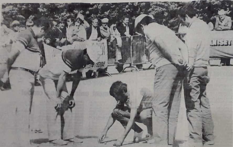
Il faut sortir le ruban pour mesurer ce point, lors de la finale. Le Vaucluse (à gauche) finira par s'imposer facilement