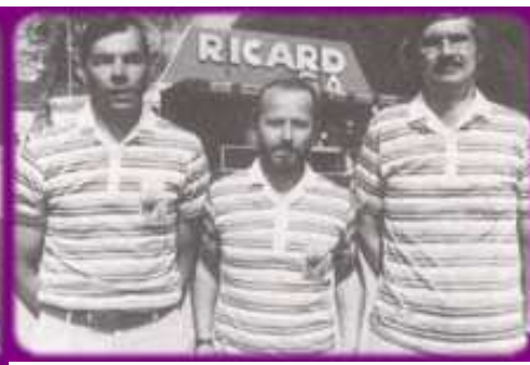
Les 2 Triplettes 1/2 finalistes de ce Championnat corporatif