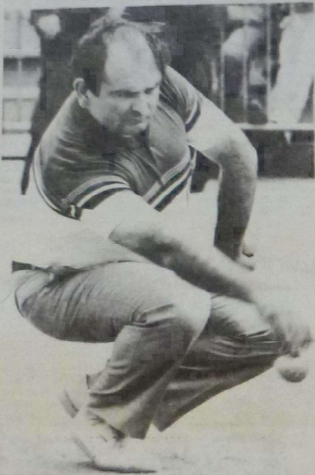
La concentration, une importance déterminante.

Durant la journée du samedi les festivités commençaient par les matches de poule. Les équipes orléanaises allaient connaître des fortunes diverses, deux se faisaient éliminer dès le premier tour, l'une par une équipe de Haute-Corse et l'autre par l'équipe de Haute-Garonne qui n'ira pas très loin dans la compétition. La troisième équipe du Loiret passait ce