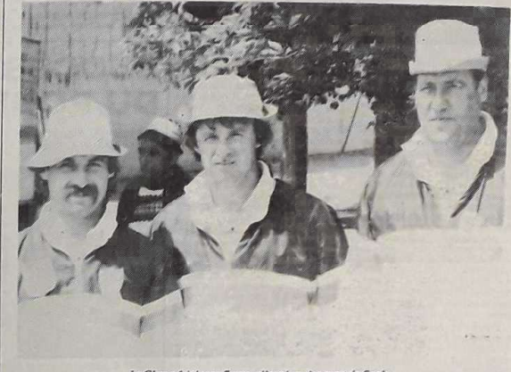
Le Cher se montre brillant, allant jusqu'en quart de finale