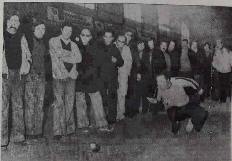
92 triplètes pour 72 départements...

DIMANCHE. — 9 heures : huitièmes de finale; 10 h 30 : quarts de finale; 14 h 30 : demi-finales; 16 h 30 : finale.