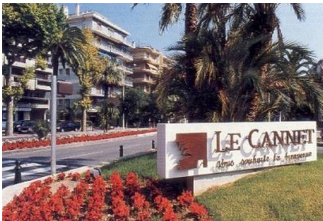
La ville de Cannet qui a accueilli ce 1er trophée national corporatif

Le 1er Championnat de France corporatif Triplette , en 1978 à Cannet (06), aura été en fait le 1er Trophée National corporatif (jusqu'à sa 3ème édition en 1980).