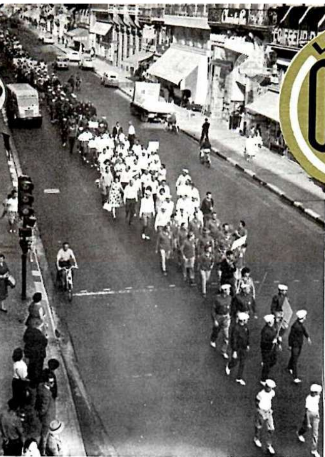
Défilé des différentes équipes dans les rues de Bordeaux