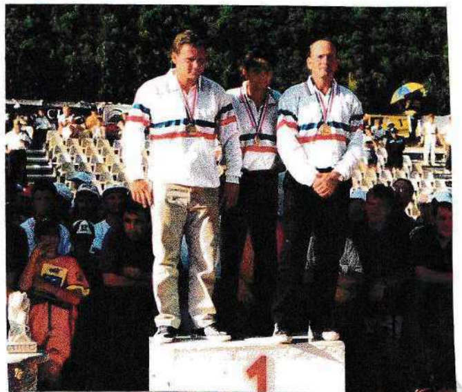
CHAMPIONS DE FRANCE