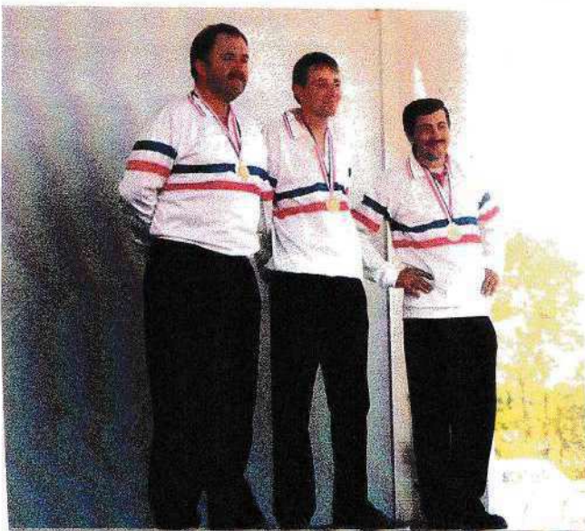
CHAMPIONS DE FRANCE