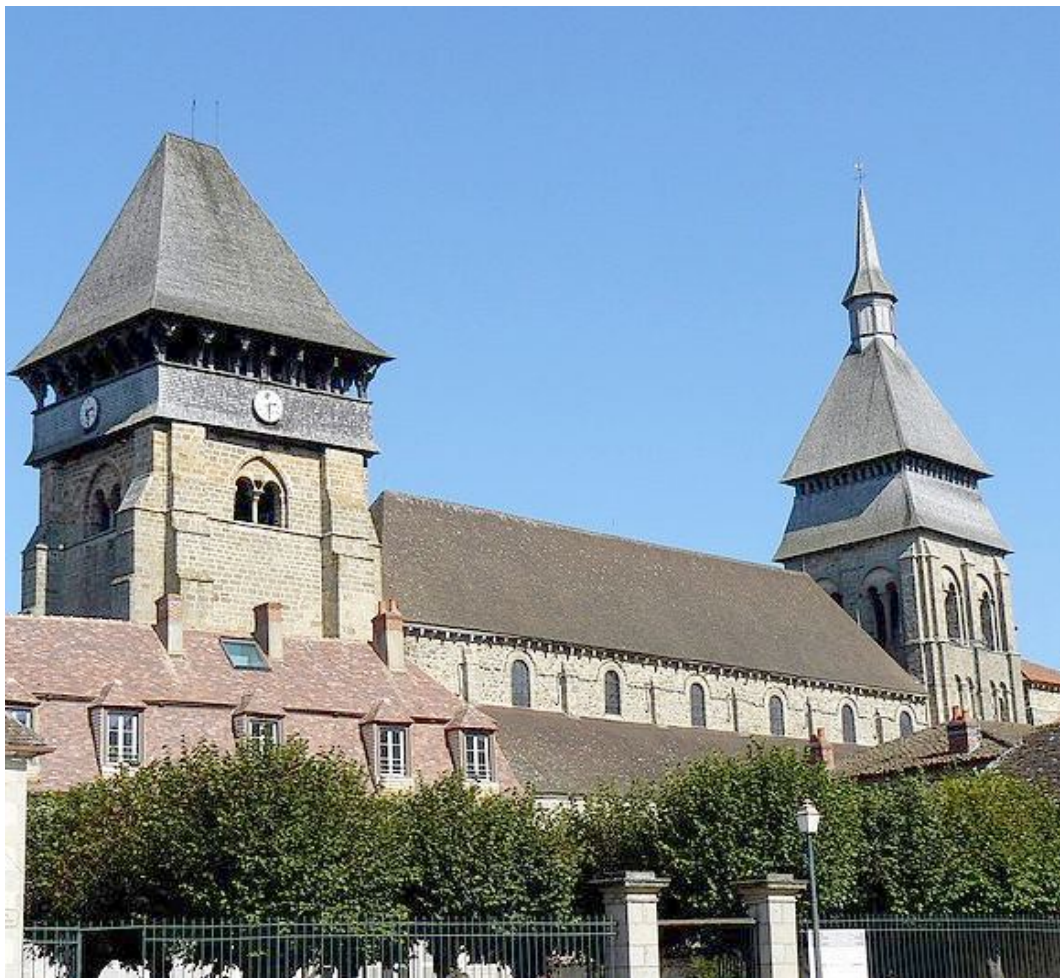
L'abbatiale Sainte-Valérie à Chambon-sur-Voueize (23)

Ce Championnat de France Tête-à-tête senior pétanque , s'est déroulé les 4 et 5 juillet 1998 à Chambon-sur-Voueize (23).