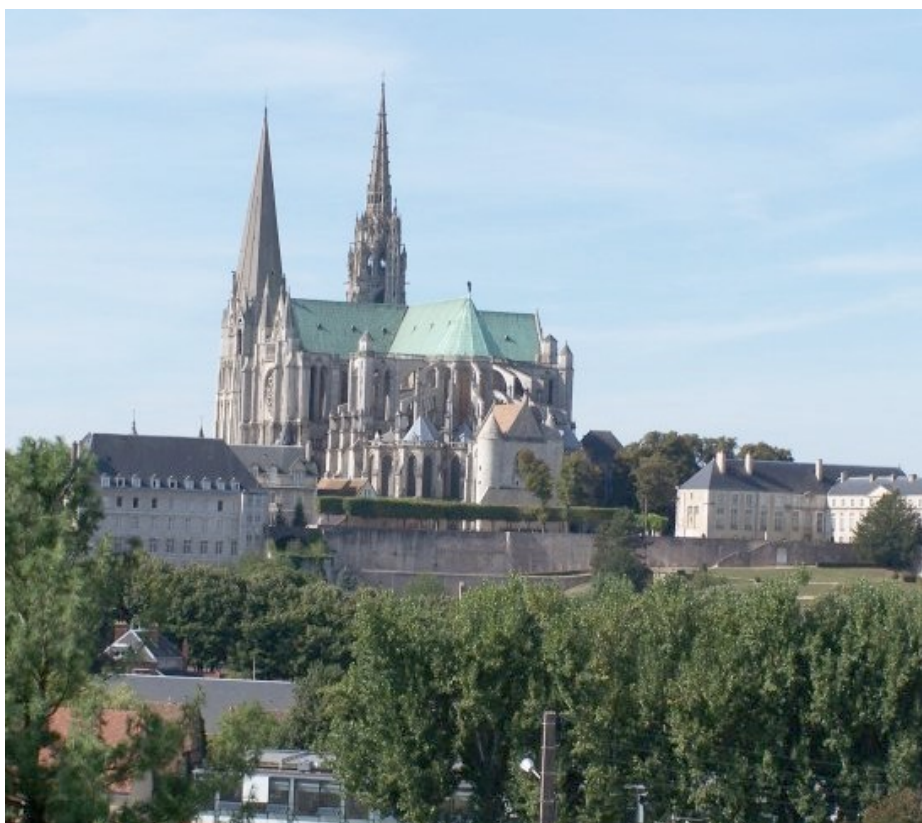
La célèbre cathédrale gothique de Notre-Dame de Chartres, inscrite au patrimoine de l'Unesco en 1979

Ce Championnat de France corporatif , s'est déroulé à Chartres (28) les 14 et 15 juin 1986.