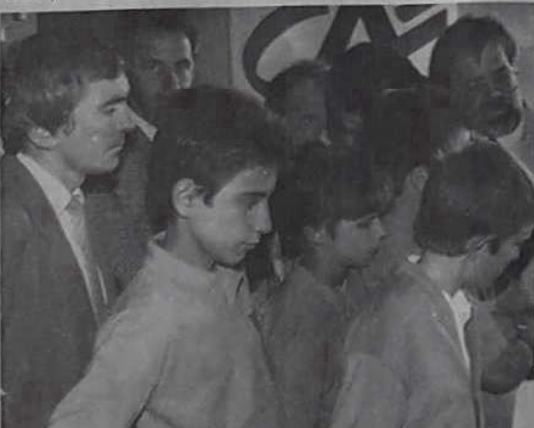
Le tirage de poules sur ordinateur