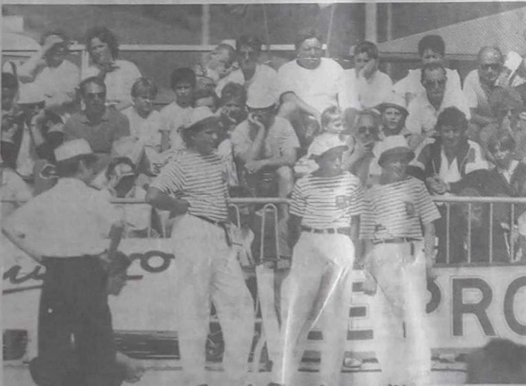
Triplette de choc sous soleil de plomb.