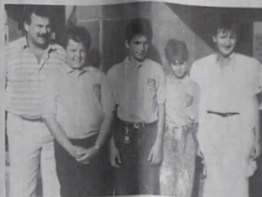
L'équipe championne du Jura : la Pétanque Bletterannoise