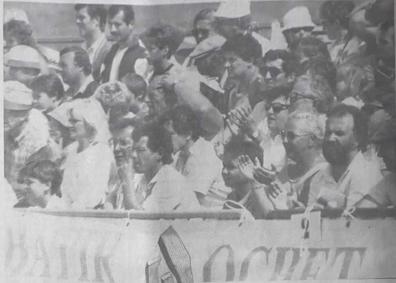
Quelque chose de Roland Garros. L'enthousiasme est là !

Minimes et cadets ont renforcé l'idée parmi le grand public que la pétanque n'était pas seulement un sport de retraités. Loin de là !