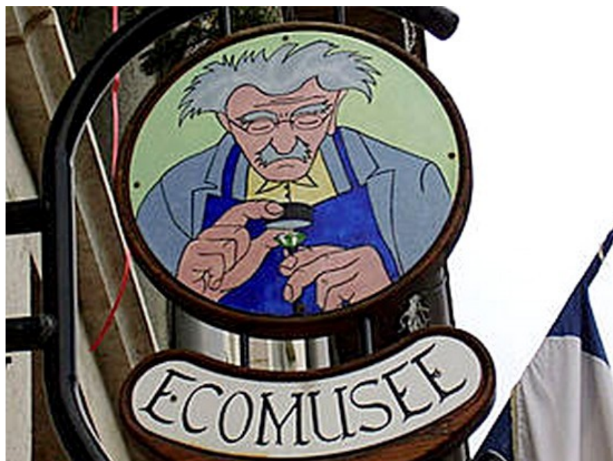
La ville de Lamoura et son musée du lapidaire, qui retrace la 2 ème activité des paysans du Haut-Jura, tailleurs de pierres destinées à la bijouterie

Ce Championnat de France Triplette cadet , s'est déroulé les 27 et 28 août 1988 à Lamoura (39).