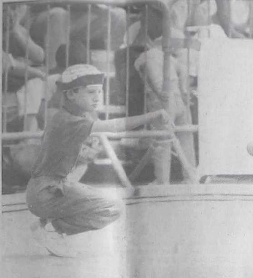
Le magnétisme du regard... carte maîtresse.