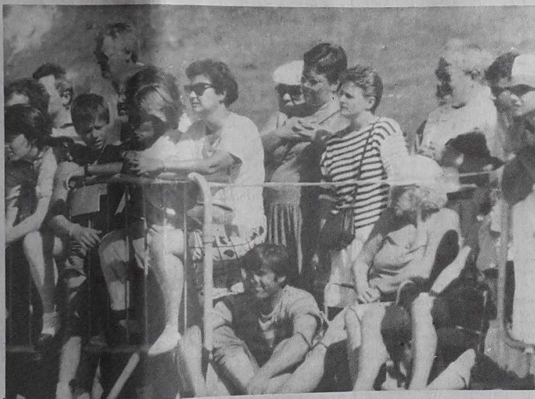
On a plus entendu hier les applaudissements des supporters que le choc des boules.

C'est un spectacle effectivement que de voir ces petits bouts d'hommes, tout à leur affaire - et dieu sait, s'ils savent prendre la gravité de l'instant - s'apprêter à pointer et à tirer. La précision, sans aucun chauvinisme, fait naître les applaudissements. Tout cela dans une ambiance moins bon enfant que l'on aurait pu l'imaginer. Les parties sont en effet très