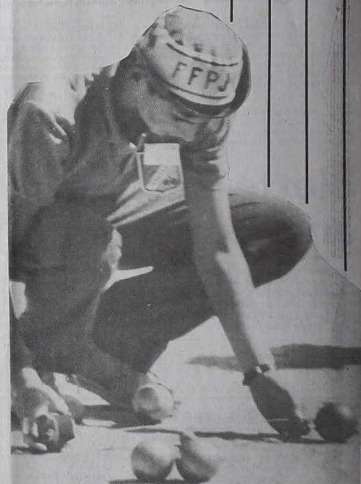
500 jeunes passionnés participent à ces championnats dans une ambiance fort sérieuse.

n'ont pas la décontraction de la pétanque. Aujourd'hui, le spectacle sera encore plus intense. Et la foule risque de grossir.