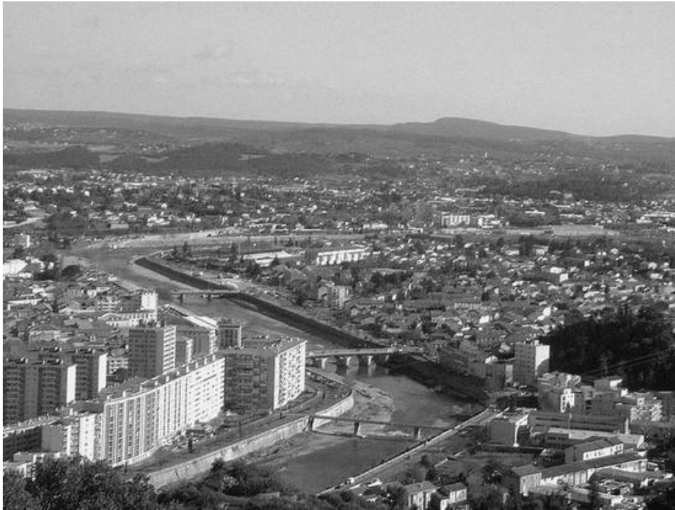
La cité minière d'Alès, qui a été l'hôte de ce Championnat de France pétanque en 1948

Ce Championnat de France Triplette senior pétanque , s'est déroulé à Alès (30), capitale des Cévennes.