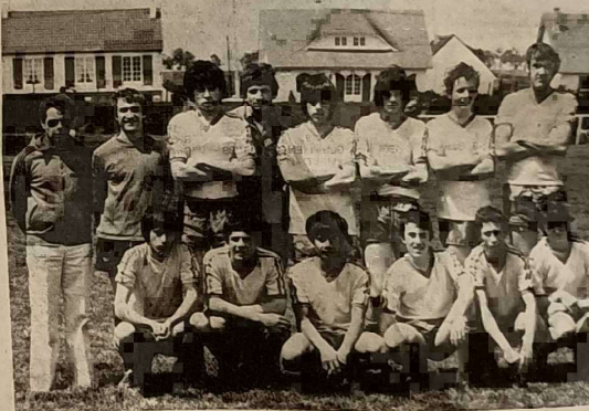
L'équipe cadets de l'U.S.O.A., vainqueur de la coupe cadets F.S.C.F.

EN CADETS: L'U.S.O.-Arago bat Rive-de-Gier : 6-4 (3-1)