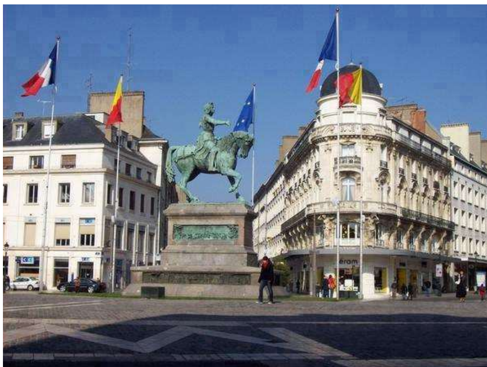
La Place Martroi à Orléans, avec la statue de Jeanne D'Arc, qui a délivré cette ville le 8 mai 1429

Pour la 3 ème édition, ce Championnat de France pétanque, est resté sur les bords de la Loire et après Joué-lès-Tours en 1976 et Nevers en 1977, c'est donc Orléans (45) qui a accueilli cette compétition Doublette féminin en 1978.