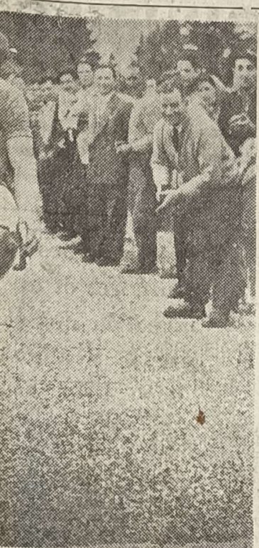
Plu passe la ligne d'arrivée en dernier kilomètre époustoufflant.

(DE NOTRE ENVOYÉ SPÉCIAL : MARCEL BARÈS)