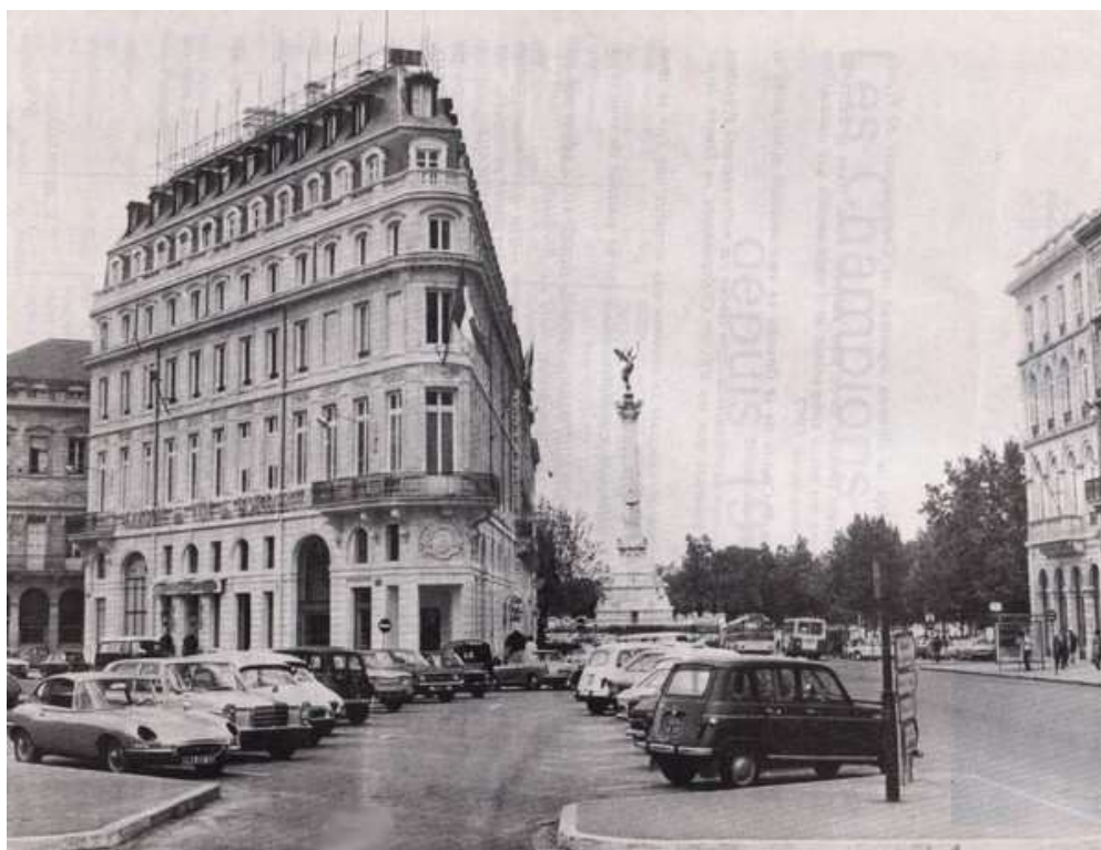
La colonne du monument aux Girondins, sur la place des Quinconces à Bordeaux, où s'est déroulé ce Championnat de France en 1962

Ce Championnat de France Triplette senior pétanque , s'est déroulé le 1er et 2 septembre 1962 à Bordeaux (33).