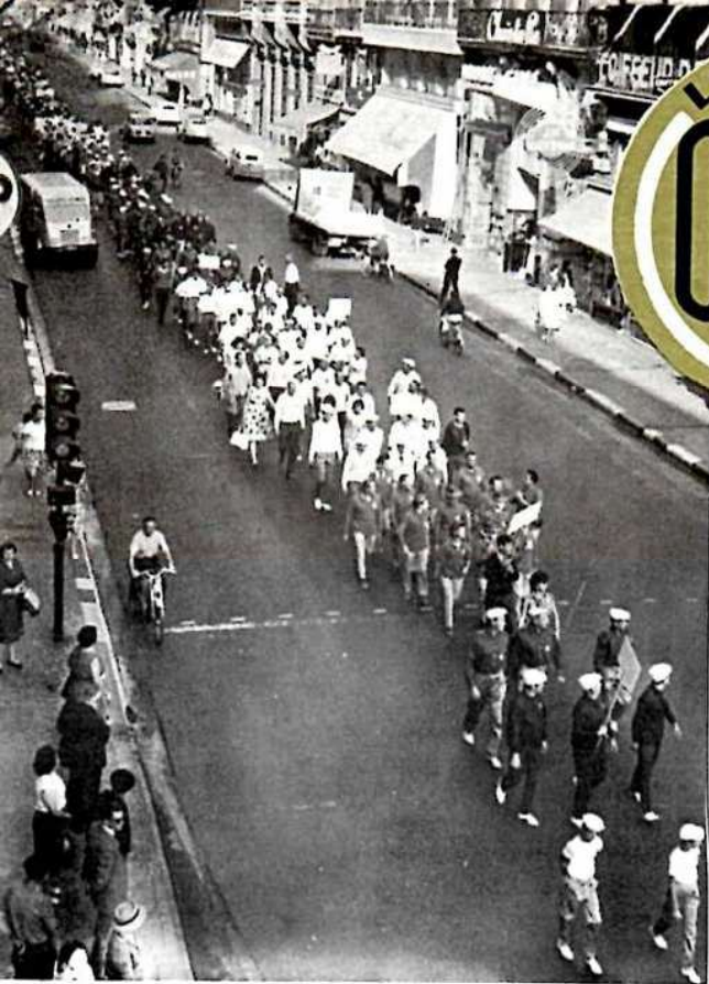
Défilé des différentes équipes dans les rues de Bordeaux