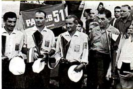
Vainqueurs 1 re catégorie, recevant leurs coupes entourant le président national.