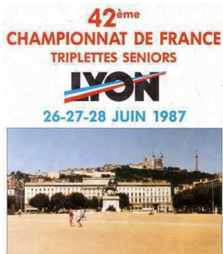
La couverture du programme de ce 42 ème Championnat de France Triplette à Lyon en 1987

Ce Championnat de France Triplette senior pétanque , s'est déroulé les 27 et 28 juin 1987 à Lyon (69).