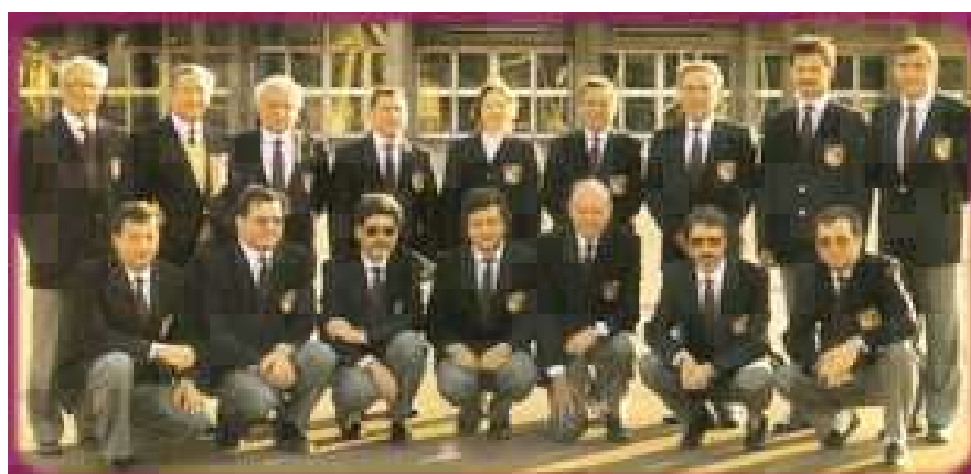
Le CD69, organisateur de ce Championnat en 1987