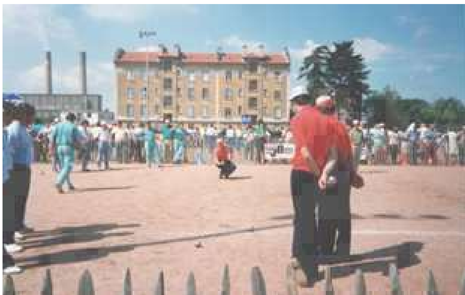
Une vue des parties du samedi après-midi, sur le stade Vologe II, à Lyon

Les tenants du titre 1986 du (06) : Arcolao, Arcolao, Zangarelli se sont inclinés en 1/64 de finale, face à Del Toso (77) sur le score de 1 à 13.