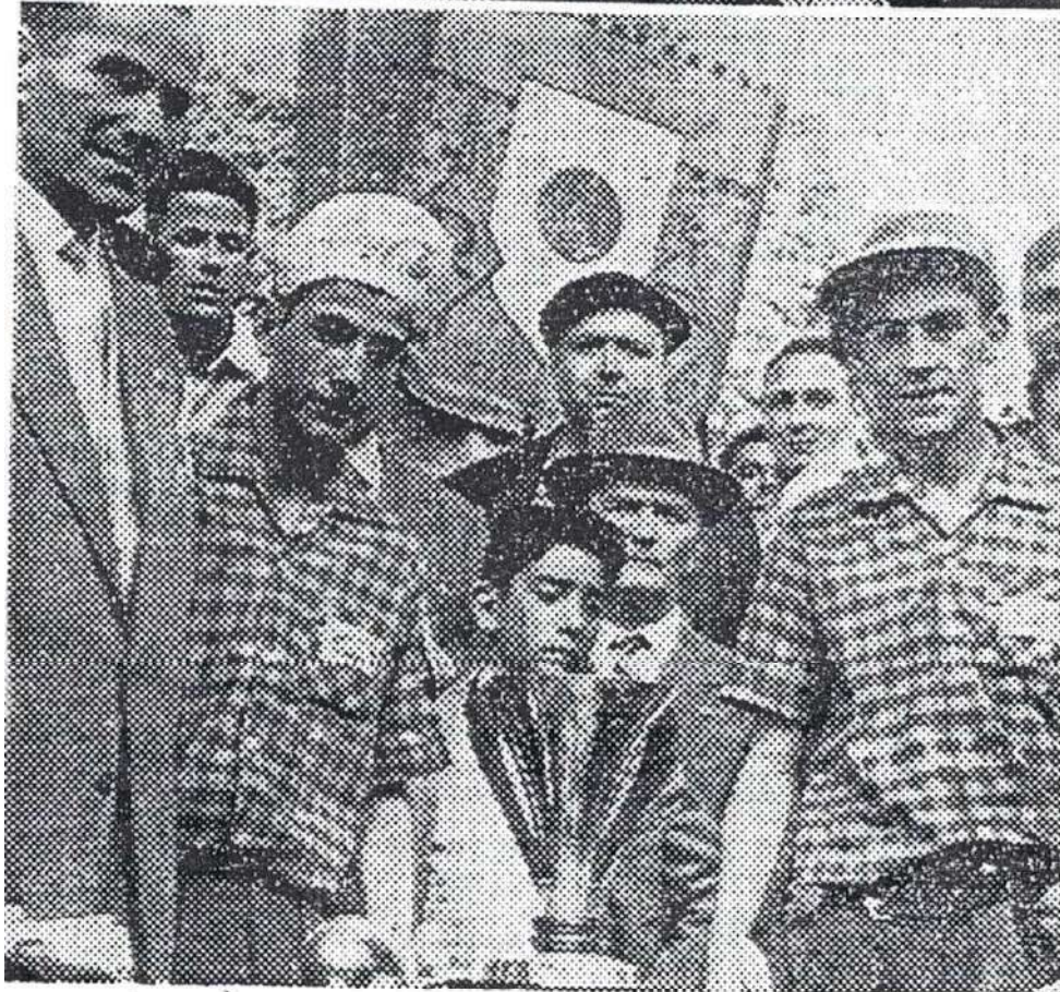
En haut : L'équipe SAURA, qui a enlevé le championnat de première catégorie. Au-dessous : L'équipe HAGIOFITIS, champion dans la catégorie juniors, vient de recevoir la coupe.