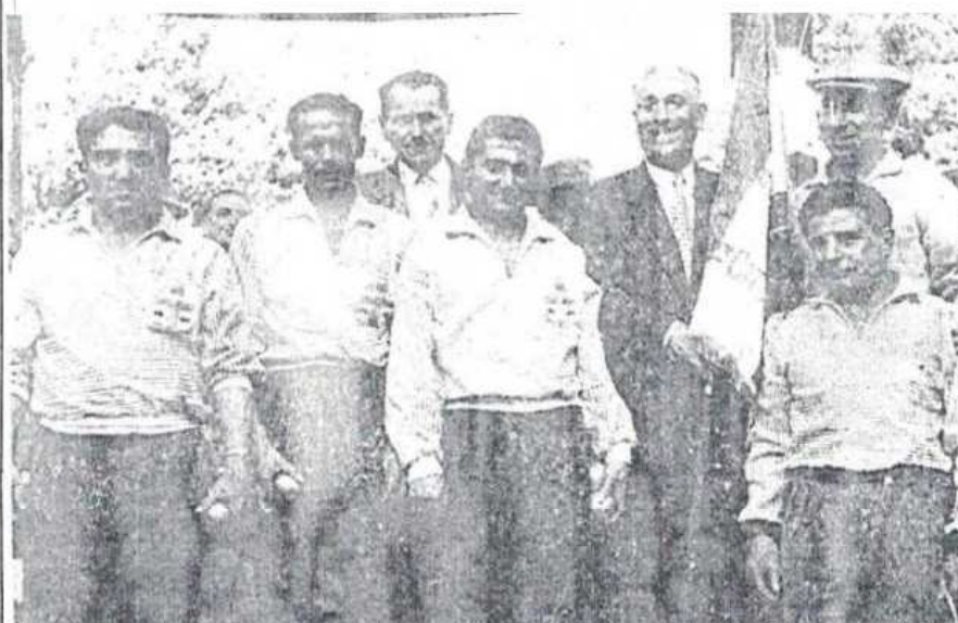
L'équipe Saura (Coq Oddo de Marseille) va recevoir le drapeau du titre de 1 ère catégorie des mains de M. P., secrétaire général de la F. F. J. P. P.

Chastellière (Drôme) gagne Panegoutit (Basses-Alpes). Hagipotis (B.-du-Rh.) gagne Cancere (Ile-de-France).