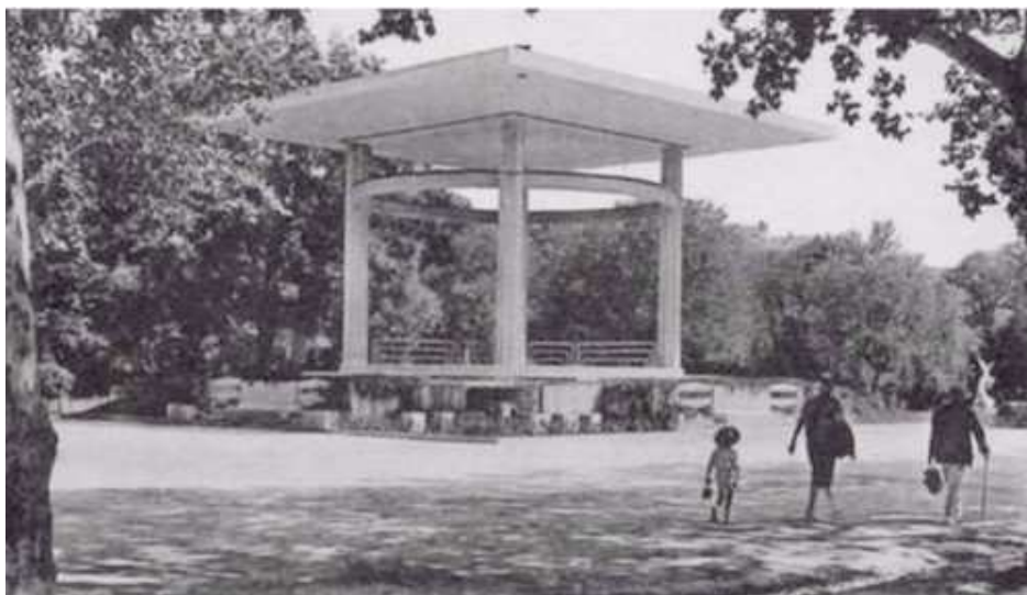
Le kiosque Bosc, sur l'Esplanade Charles de Gaulle, où fut installé le graphique, durant ce Championnat