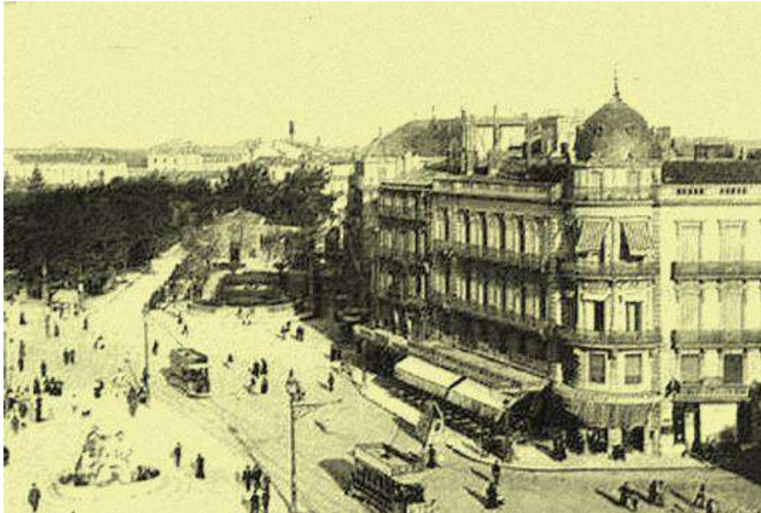
La Place de la Comédie à Montpellier dans les années 50 En haut à gauche l'Esplanade de la Comédie, où s'est déroulé ce Championnat

Ce Championnat de France Triplette senior, s'est déroulé les 16 et 17 juin 1956 à Montpellier (34).