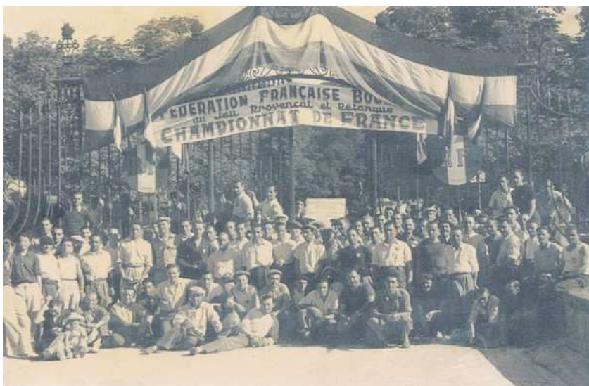
Les participants à ce Championnat, ont pris la pose, devant le portail, des jardins de la Fontaine