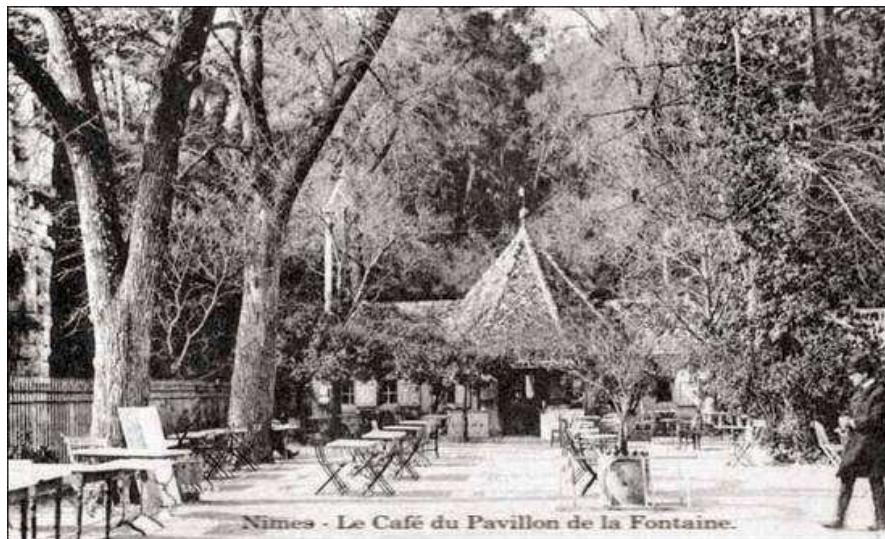
Le café du pavillon des Jardins de la Fontaine à Nîmes dans les années 50

Ce Championnat de France Triplette senior pétanque , s'est déroulé à Nîmes (30).