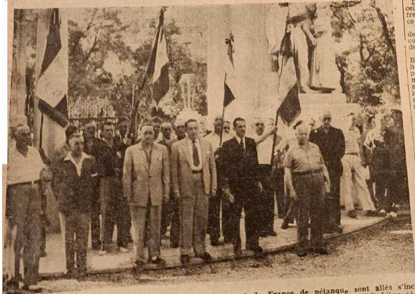
Les joueurs de boules ayant participé au championnat de France de pétanque sont allés s'incliner devant le monuments aux Morts.

Mieux choisir entre des produits plus nombreux, fabriqués en plus grande série, et vendus à meilleur prix, c'est ce que vous pouvez faire grâce à la Publicité.