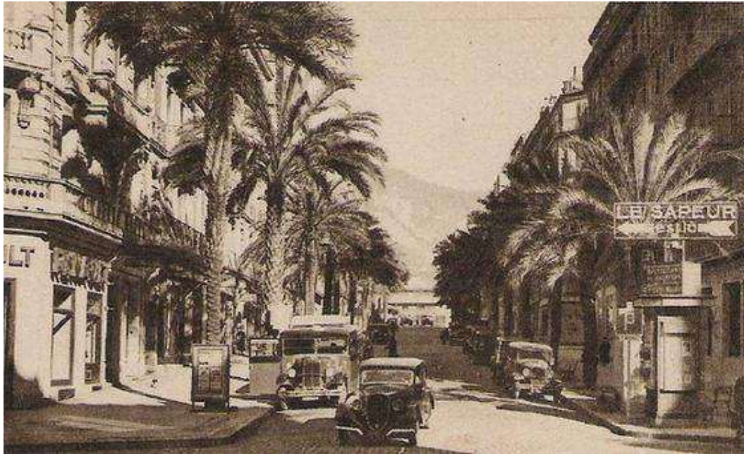
L'Avenue Colbert à Toulon en 1951

Ce Championnat de France Triplette senior pétanque , s'est déroulé à Toulon (83).