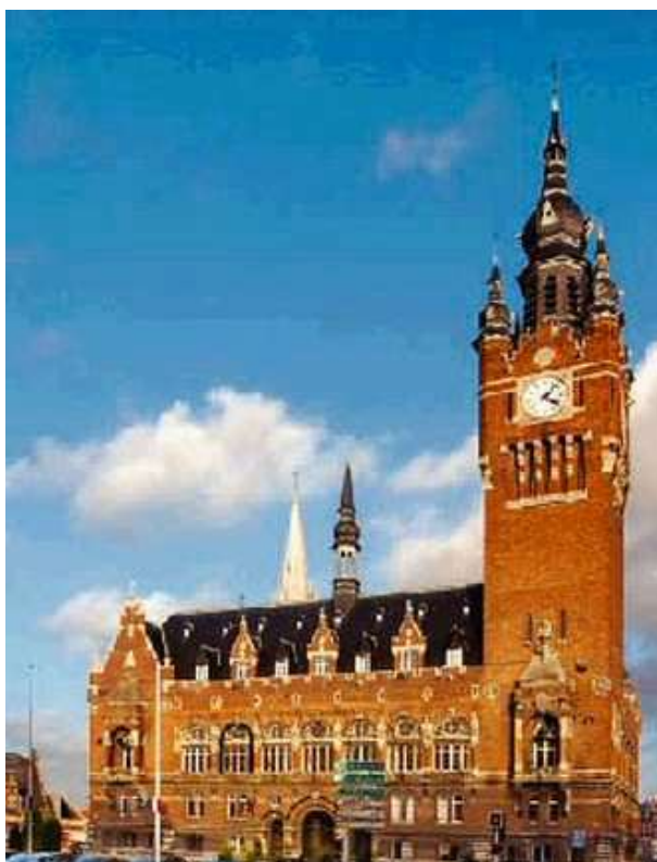
La ville d'Armentières (59) et son beffroi de l'Hôtel de Ville, classé au patrimoine de l'Unesco

Le 4 ème Championnat de France Triplette minime , s'est déroulé les 29 et 30 août 1987 à Armentières (59).