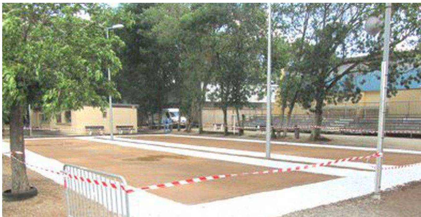
Les terrains des phases finales devant les tribunes.