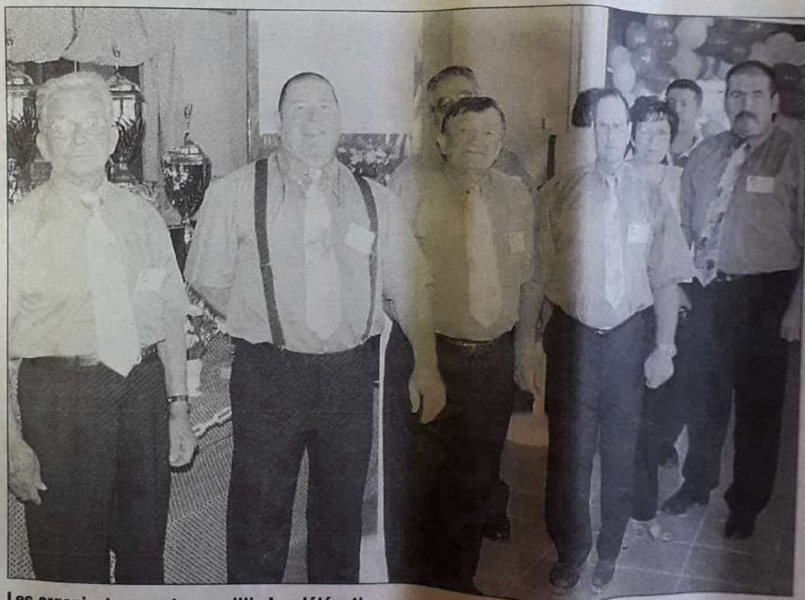
Les organisateurs ont accueillis les délégations.