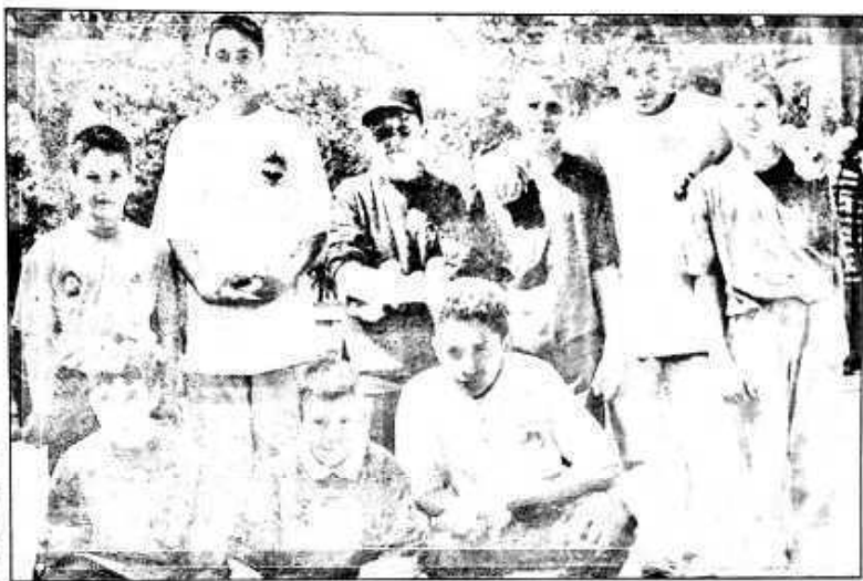
Les Cadets, à Meyrargues pour le titre du comité et la sélection à la ligue

D'autre part, nous agissons en partenariat pour rétablir, à Marseille, le très