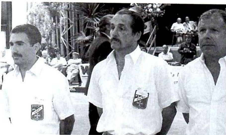
Les champions de France.