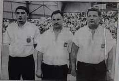
La solide formation venue du Calvados.