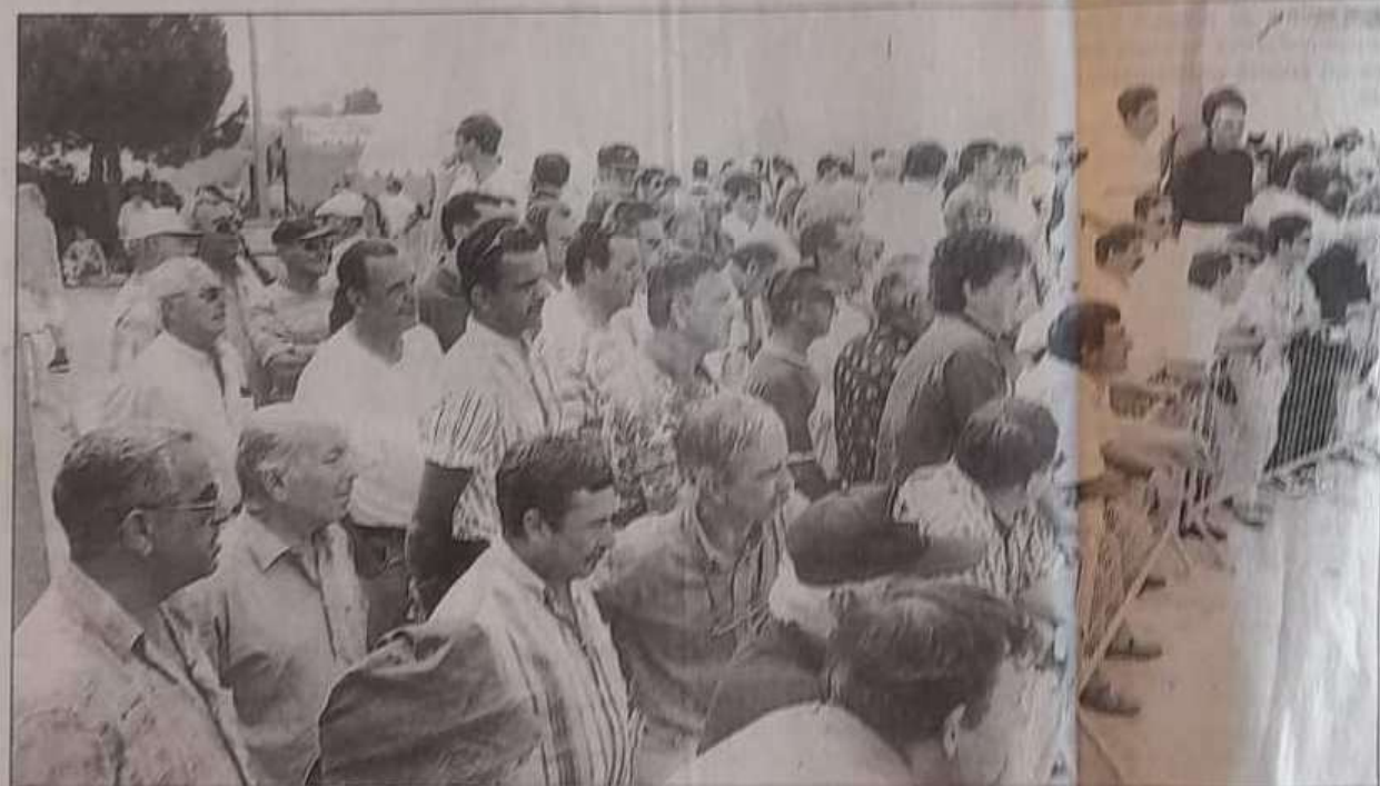
Un public venu tous les jours très nombreux.