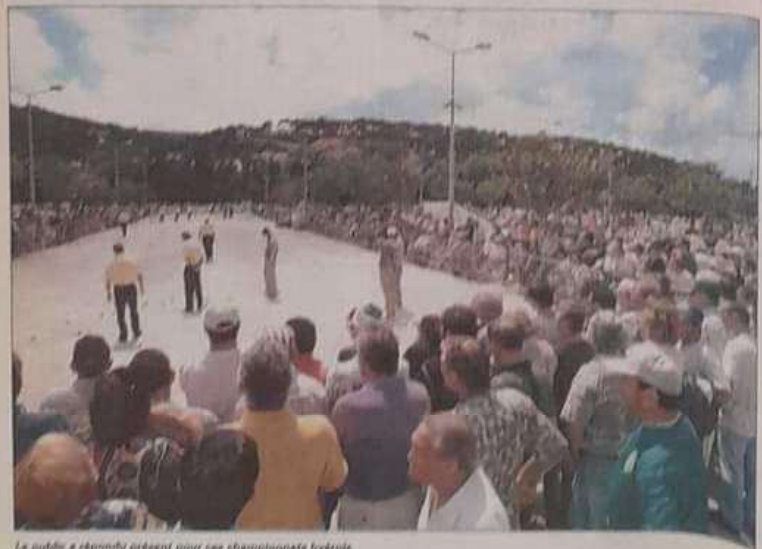
Le public a répondu présent pour ses championnats hyérois.