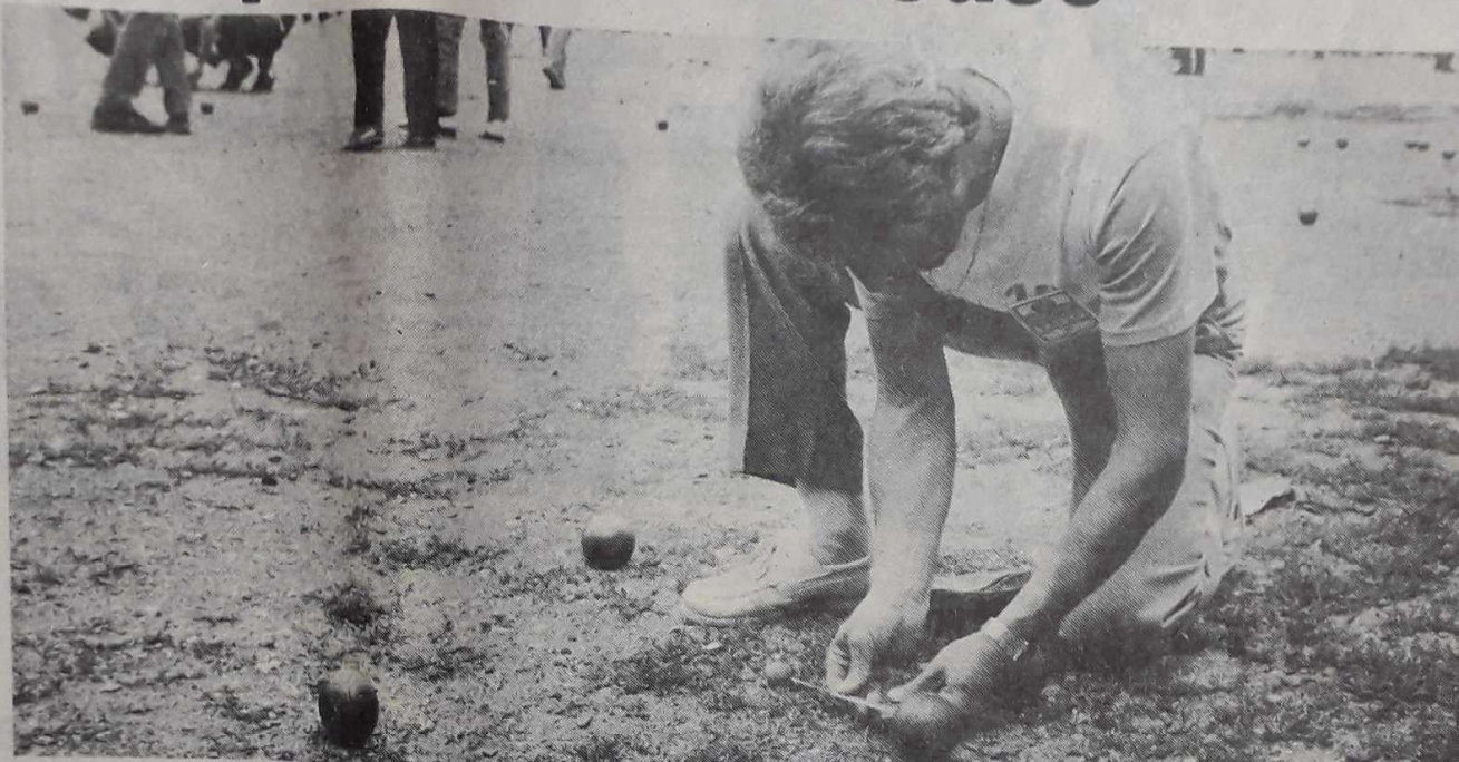
Les titres se jouent parfois à peu de chose..