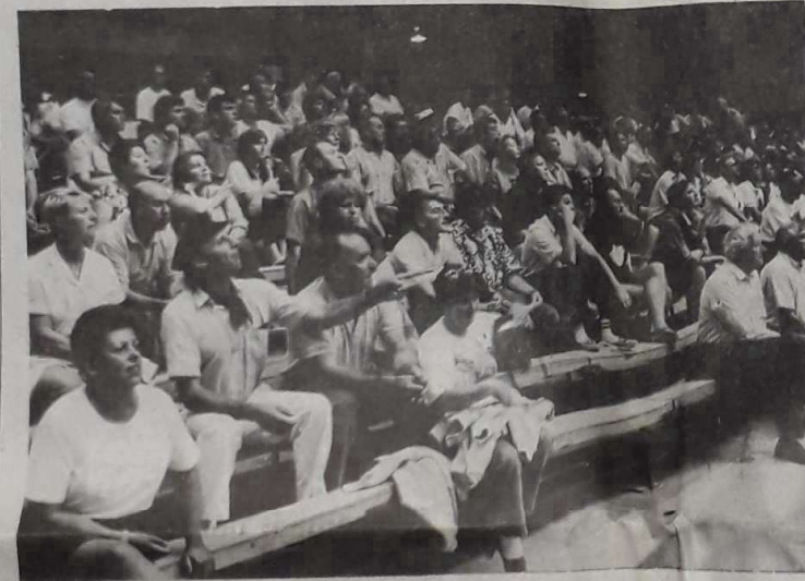
Public averti et passionné.

Les quarante-cinquième championnats de France de jeu provençal en triplette ont connu leur ultime affrontement, hier après-midi, au Parc des expositions de Toulouse en présence d'un bon public, très ouvert, si l'on en juge à ses réactions des choses de la boule.