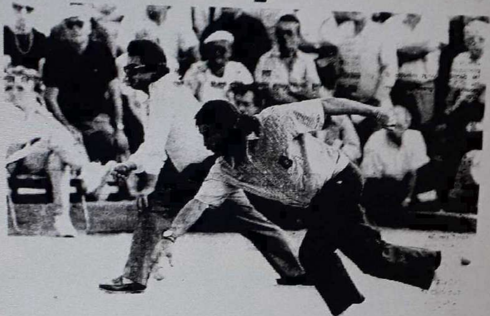
Le jeu provençal, toujours spectaculaire et très apprécié du public.

Ce sport qui persiste à conserver jeune.