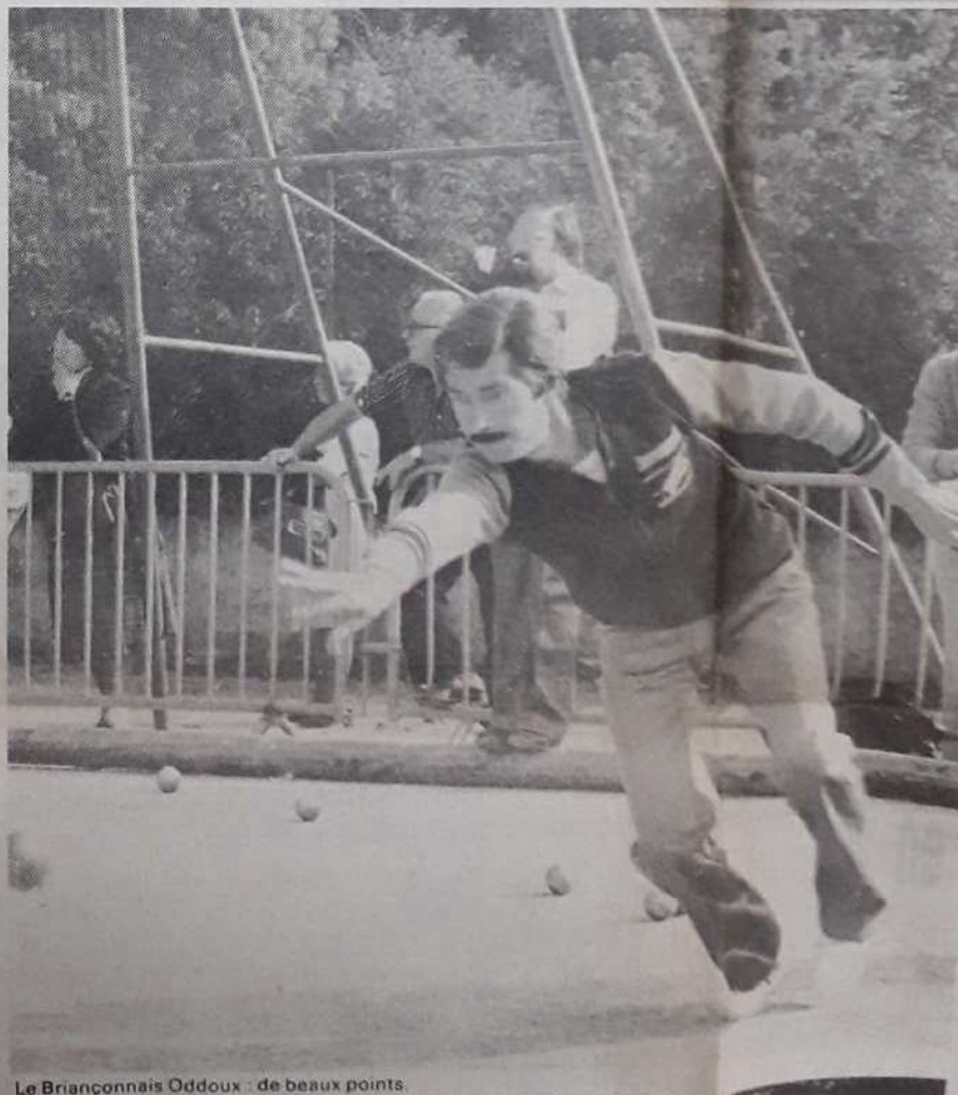
Le Briançonnais Oddoux : de beaux points.

A l'issue de la finale, remise des prix et récompenses, passages