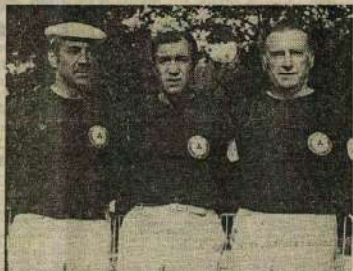
Otello, Vivanco, Jully (Carpentras).

Pour les Audois, toujours aux portées des Arènes, l'aventure championnat de France ressemble beaucoup à celle de Carbonei et Ca-