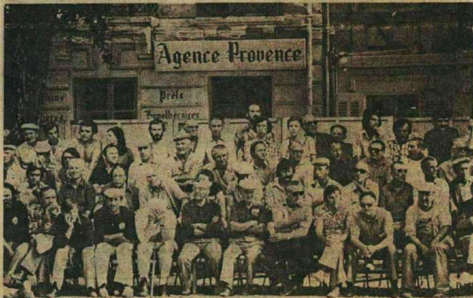
Une vue du public pendant la finale.

Et puis, il y eut aussi ces conditions atmosphériques typiquement provençales qui favorisèrent le succès populaire de cette grande manifestation. Succès qui dépassa largement les