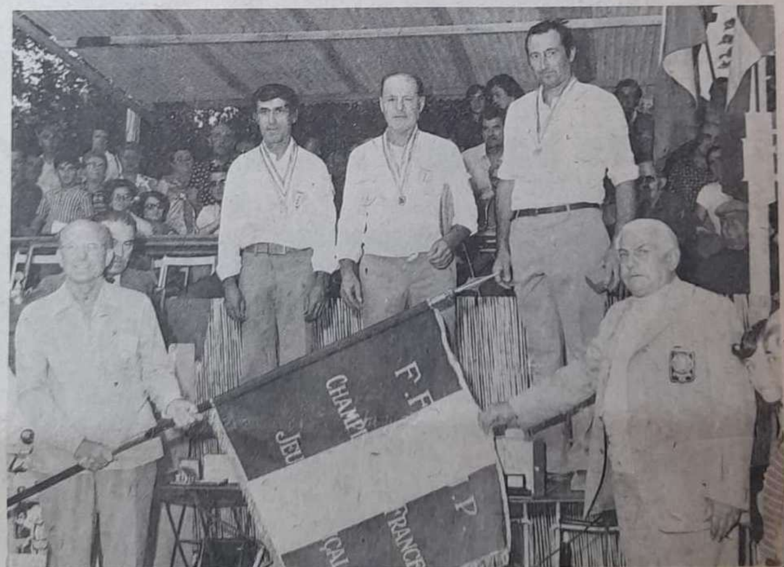
Les champions de France sur le podium.