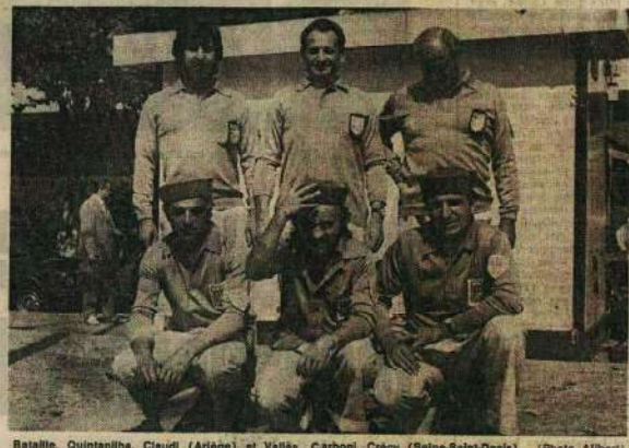
Batalie, Quintanilha, Claudi (Ariège) et Vallès, Carbon, Crécy (Seine-Saint-Denis).