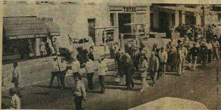
Le défilé des équipes et officiels à travers Draguignan.

De sévères explications en perspective au cours de cette longue journée qui verra se disputer trois tours (seizièmes, huitièmes et quarts de finale). J. A.