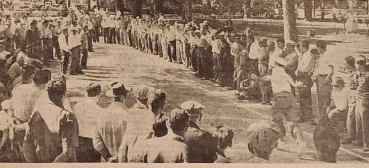
Une partie ardemment disputée oppose ci-dessus l'équipe Baidi du Var, à celle d'Agaccio, des Bouches-du-Rhône, et se terminera par la victoire des Vercors.