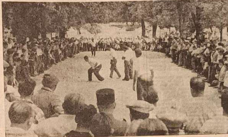
La foule se presse pour applaudir les équipes restant en lice aux ultimes parties d'un championnat ardemment disputé.