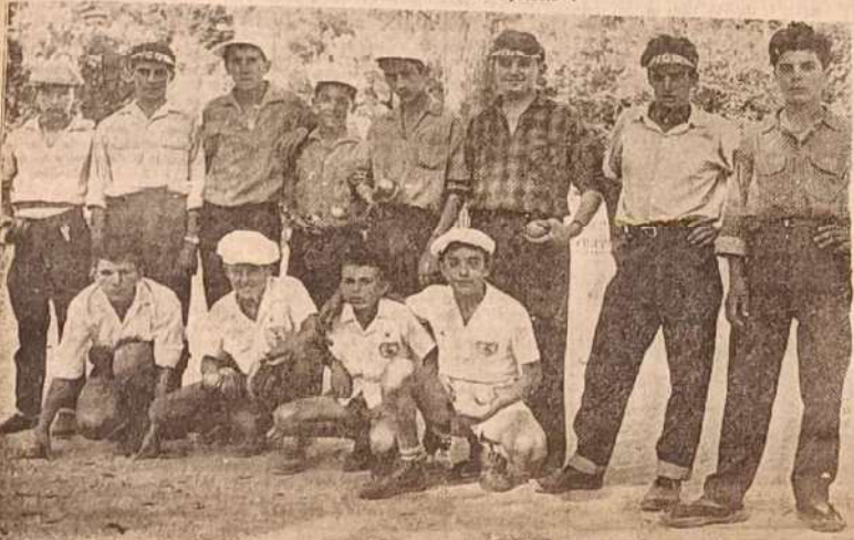
Voilà le groupe des juniors, dont l'équipe gardoise de Saint-Césaire, qui remporta la première place en battant l'équipe marseillaise par 15 à 7.

En raison du mauvais temps, la finale du concours de boules est renvoyée à cet après-midi, 15 h. aux Arènes.