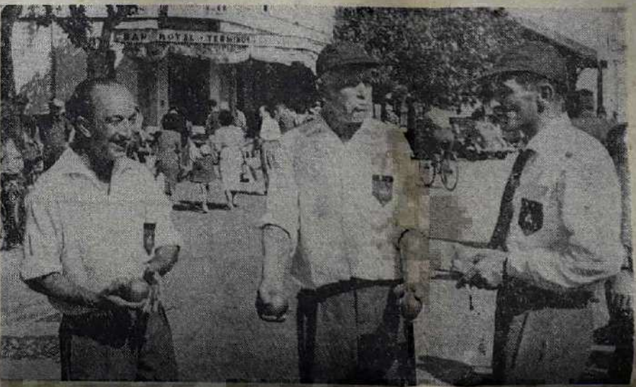
Le Bouc n'est pas content. Castie écoute avec intérêt les propos de son chef d'équipe, l'aide Espanet ne semble pas prendre la chose trop au sérieux.

Seul le quart de finale de Baldi-Le Bouc et Barto contre Lange, Bruna et Brest n'a pu se terminer (score 13 à 11 pour les deuxièmes). La partie reprend ce matin à 9 h.