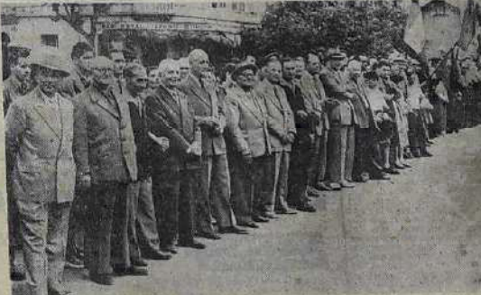
Les autorités au moment de la constitution des équipes.