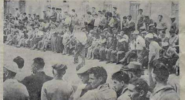
Les Hyérois ont été éliminés aux quarts de finale. En attendant de pouvoir le constater sur notre cliché, il ne manquait plus de supporters.