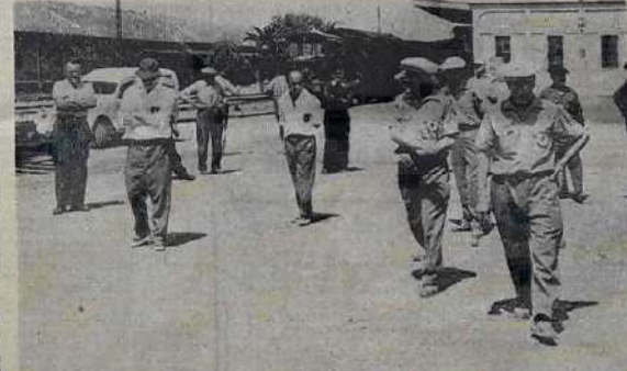
Photo DURIEUX, 38, Avenue des Lies-d'Or - HYÈRES LE BOUC, ESPANET, CASTIE et leurs adversaires des quarts de finale

Crise dénouée au R.C.T. M. Couderc revient