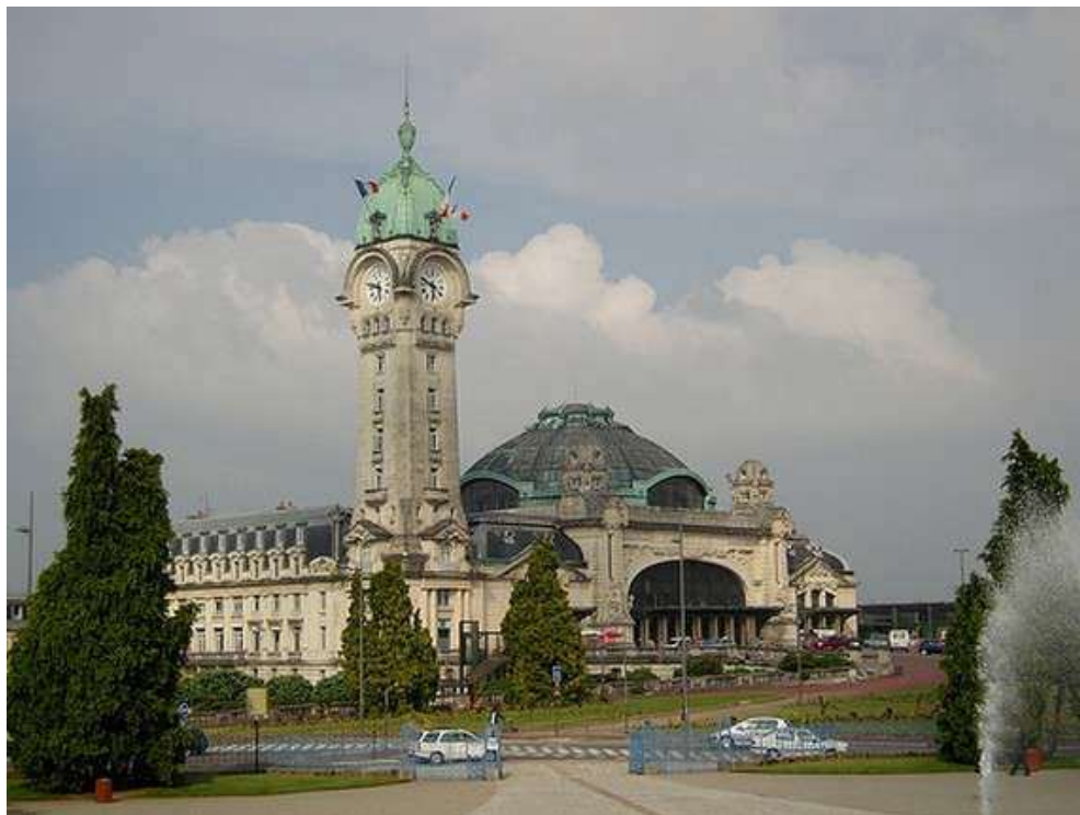
La magnifique gare de Limoges-Bénédictins, construite en 1929 par l'architecte Roger Gonthier

La ville de Limoges (87), a reçu cette compétition sportive chez les juniors.