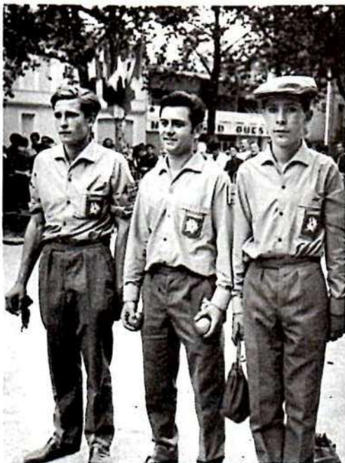
l'équipe bordelaise, championne de France de Pétanque (Junior)