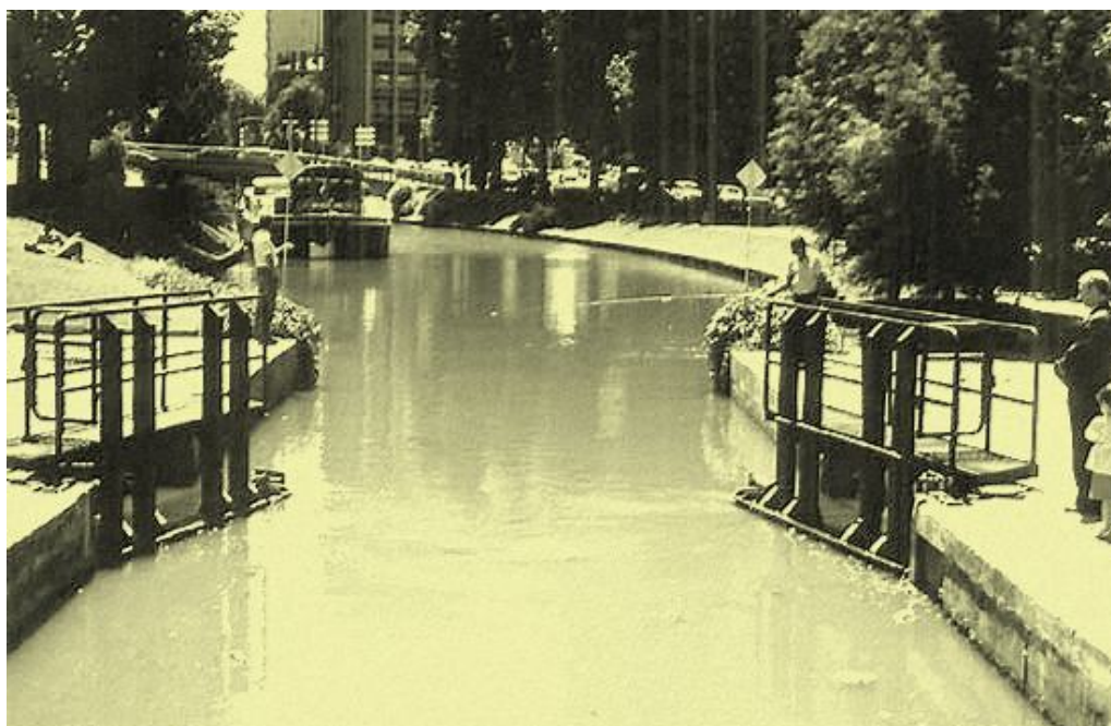
Le canal du Midi face à la gare S-N-C-F de Toulouse, 2 écluses plus loin on se retrouve au boulo-drome des Zéphyr, où s'est déroulé ce Championnat

Ce Championnat de France Triplette junior , s'est déroulé à Toulouse (31).