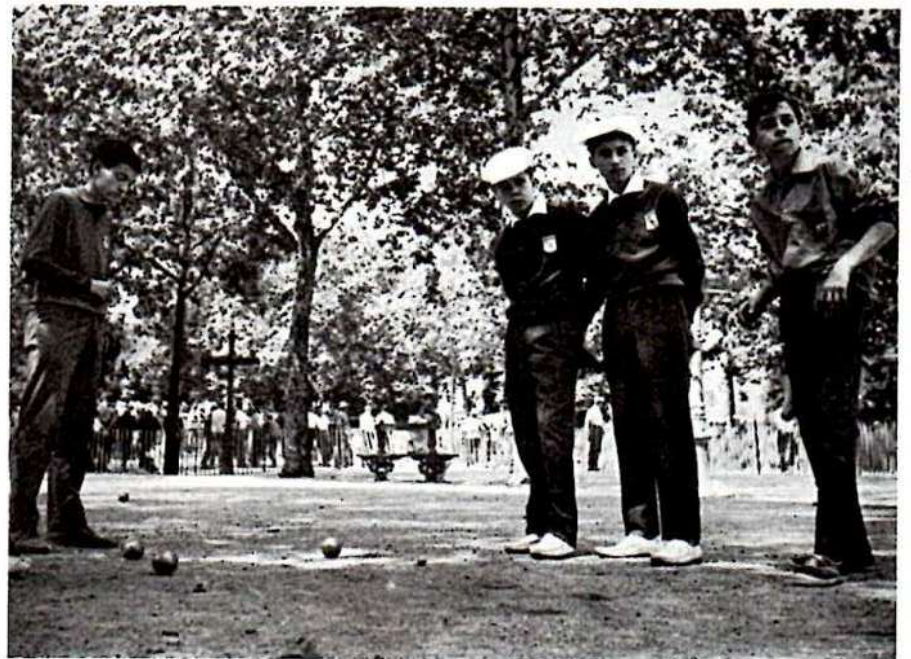
une triplette alsacienne sous les ombrages va reprendre le point.