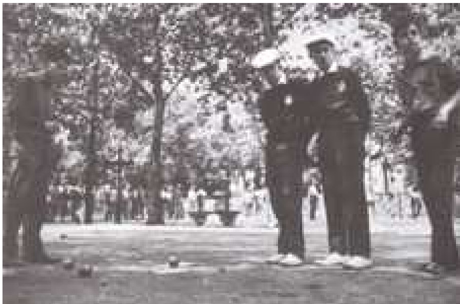
Une vue générale des terrains de ce Championnat de France junior au boulodrome des Zéphyrus à Toulouse en 1963

Ce Championnat a débuté le samedi matin et a été perturbé par un orage en milieu de matinée. Il s'est déroulé en poules , avec 72 Triplettes qualifiées.