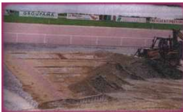
L'hippodrome de Bellevue la forêt à Laval, qui a accueilli ce Championnat entreprise Quelques travaux de terrassement ont été nécessaires, pour recevoir les pétanqueurs, juste devant la tribune de l'hippodrome Lavallois

C'est sur le site de l' Hippodrome «Bellevue la Forêt» à Laval, que s'est déroulée cette 22 ème édition entreprise.