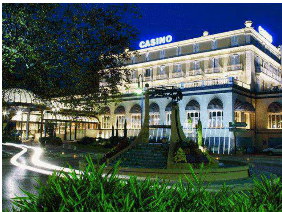
Le Casino très fréquenté, de la ville de Divonne-les-Bains

Ce Championnat de France corporatif , s'est déroulé à Divonne-les-Bains (01) les 15 et 16 juin 1996.